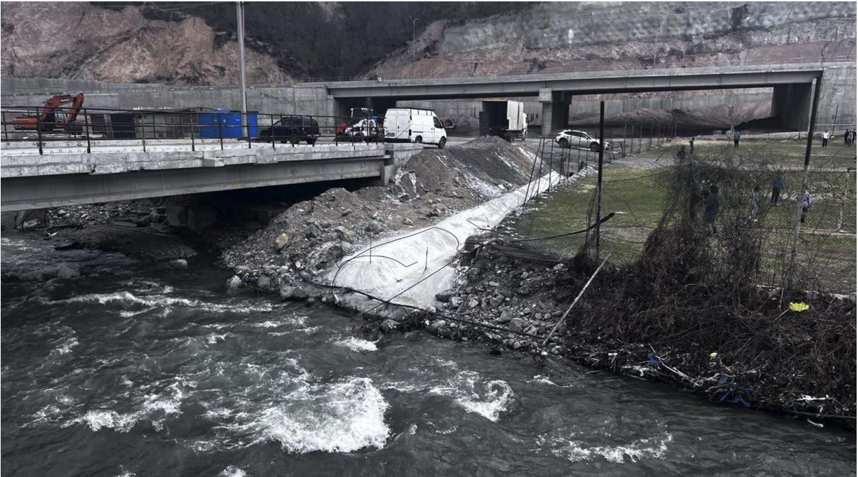
ფიგურა 7 ფუჭი ქანებით შევიწროებული კალაპოტი მდნარე რიკოთულას ზემო წელი