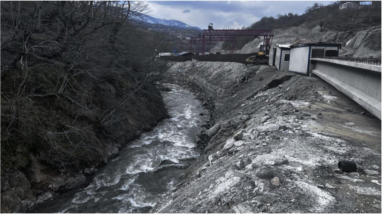
ფიგურა 9 მდინარის ხეობაში არსებული ფუჭი ქანები სკოლის ზედა მხარეს.