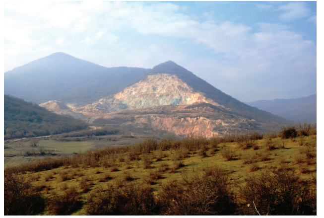
ოქროს მოპოვება ტყის ეკოსისტემების ტერიტორიაზე, ბოლნისის და ღმანისის რაიონები