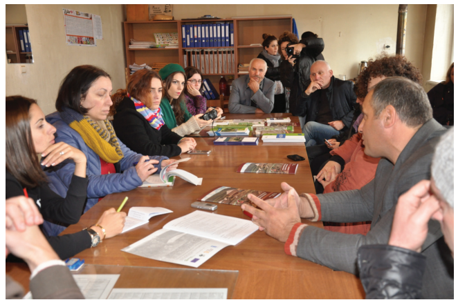
შეხვედრები ადგილობრივი მოსახლეობის წარმომადგენლებთან, ბოლნისის რაიონის სოფელი დისველი

პროექტით გათვალისწინებული აქტივობები, მათ შორის კვლევის შედეგების, პროგრამული დოკუმენტებისა და სახელმძღვანელოების გამოქვეყნება, ისევე როგორც კომენტარები საკანონმდებლო აქტების პროექტებთან დაკავშირებით, დაეხმარა ტყის/გარემოს მართვის მონაწილეობით პროცესების გაძლიერებას. „მინის გონივრული მართვის სახელმძღვანელოში“ ახსნილია ტყის სწორი მმართველობის ხუთი ძირითადი პრინციპი. ამ პრინციპებში შედის გამჭვირვალობა, მონაწილეობა და ანგარიშგება. ეს ინდიკატორები ფართოდ განიხილებოდა სემინარებსა და სამთავრობო უწყებების წარმომადგენლებთან შეხვედრების დროს; მონაწილეებმა ასევე გაიარეს მომზადება იმასთან დაკავშირებით, თუ როგორ გამოიყენება ეს სახელმძღვანელო პრინციპები გადამწყვეტილების მიღების პროცესში.