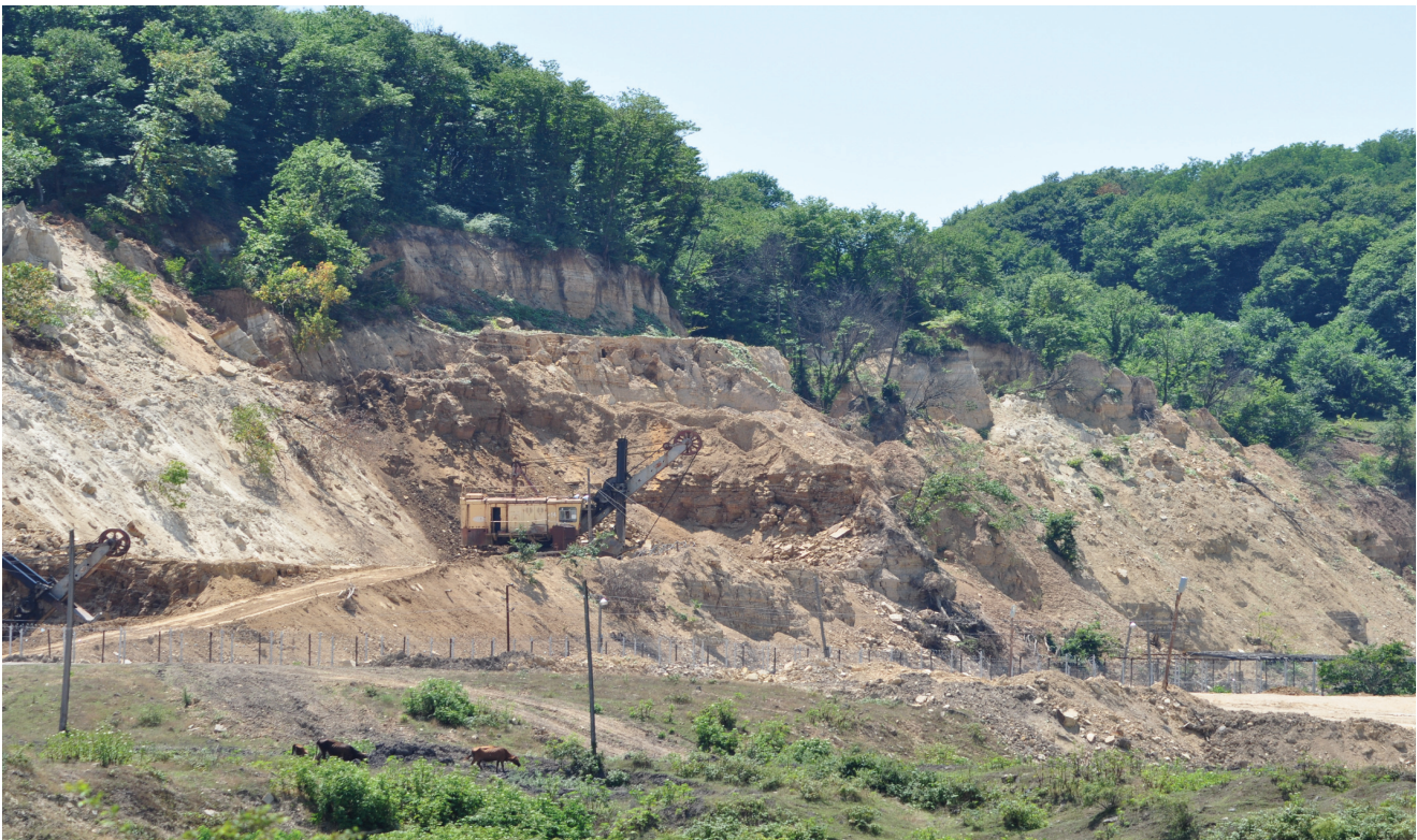
წიაღის მოპოვება გადაშენების საფრთხის წინაშე მყოფ ნაბლის ტყეებში, ჭიათურის რაიონი