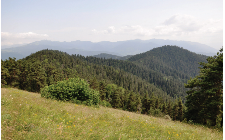
მცირე კავკასიონის ტყის ეკოსისტემები