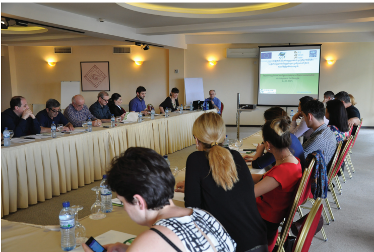
სემინარი გადამწყვეტილების მიმდებარე, თბილისი 14.06.2015

შეხვედრები და სემინარები დაეხმარა მწვანე ალტერნატივას ტყეების მართვასთან დაკავშირებული პრობლემების გარემოსდაცვითი თვალსაზრისით უსაფრთხო გადაწყვეტის გზების ადვოკატირებაში. უფრო მეტიც, სატყეო მიწების მართვის კანონმდებლობის, პოლიტიკისა და პრაქტიკის შეფასებამ, ისევე როგორც ინტერვიუების, კვლევების, შეხვედრებისა და სავლელ გასვლების დროს შეგროვებულმა მონაცემებმა ხელი შეუწყო მწვანე ალტერნატივის მიერ ტყის კატეგორიზაციის სისტემის მომზადებას. ეს სისტემა მოწინააღმდეგე იქნა დაინტერესებული მხარეების მიერ, გარემოსა და ბუნებრივი რესურსების დაცვის სამინისტროს ჩათვლით.