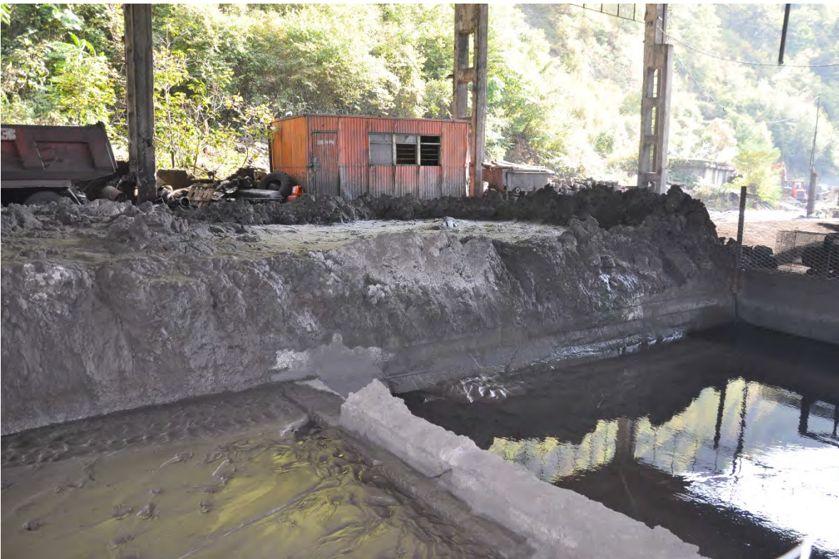
8. ქ. ჭიათურა. ასე გამოიყურება სანარმოების სალექარი, რომელშიც უნდა მოხდეს გამოყენებული წლის გასუფთავება. სწორედ ასე გაფილტრული წყალი ჩაედინება შემდეგ ყვირილაში. გაუგებარია სად მიდის სალექარებიდან ამოღებული ლამი.