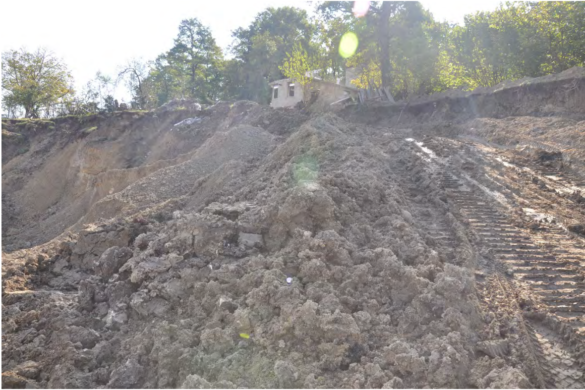
64. სოფ. დარკვეთი. კარიერზე ახალი დაწყებულია სამუშაოები. სახლების ნაწილი უკვე დანგრეულია.