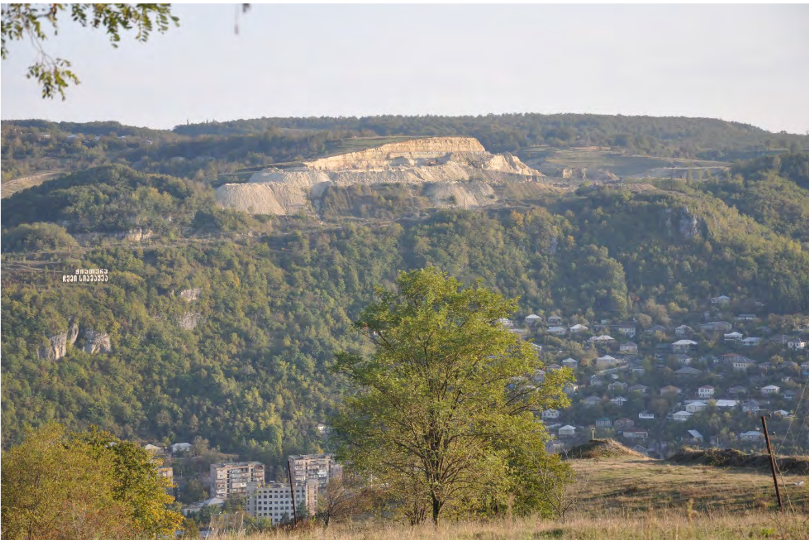
4. ქ. ჭიათურა, ღია კარიერული წესით მოპოვების შედეგი