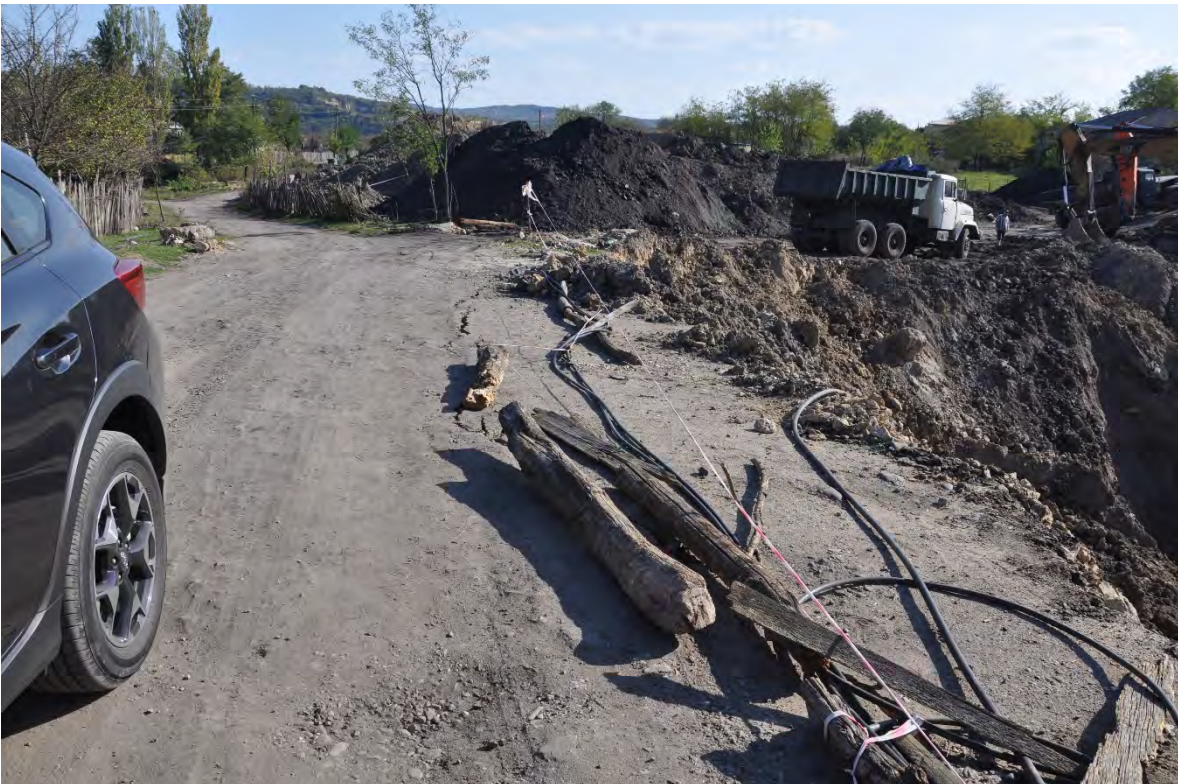
18. სოფ. მღვიმევი. ღია კარიერული მოპოვების შედეგად სოფლის გზა ნელ-ნელა ინგრევა. სამუშაოები მაინც არ შეჩერებულა.