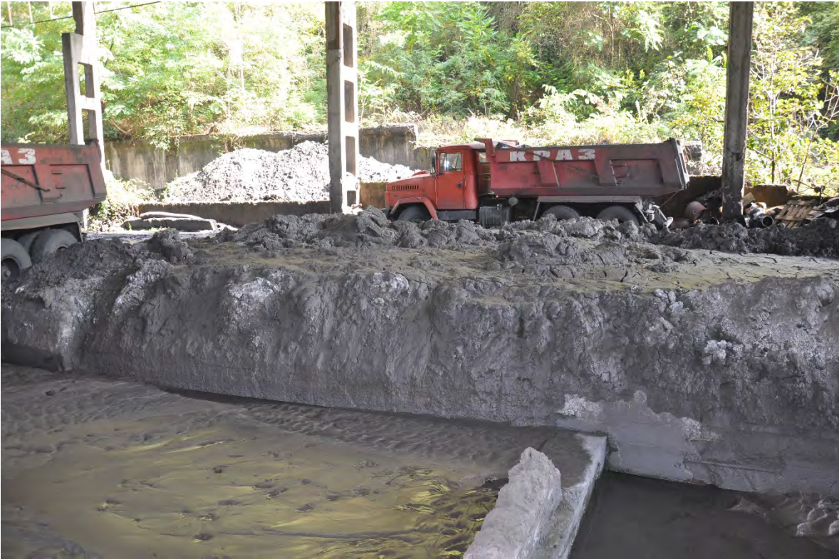
7. ქ. ჭიათურა. ასე გამოიყურება სანარმოების სალექარი, რომელშიც უნდა მოხდეს გამოყენებული წლის გასუფთავება. სწორედ ასე გაფილტრული წყალი ჩაედინება შემდეგ ყვირილაში. გაუგებარია სად მიდის სალექარებიდან ამოღებული ლამი.