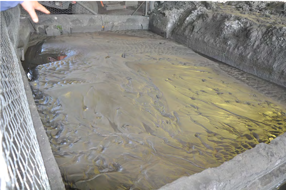
6. ქ. ჭიათურა. ასე გამოიყურება სანარმოების სალექარი, რომელშიც უნდა მოხდეს გამოყენებული წლის გასუფთავება. სწორედ ასე გაფილტრული წყალი ჩაედინება შემდეგ ყვირილაში. გაუგებარია სად მიდის სალექარებიდან ამოღებული ლამი.