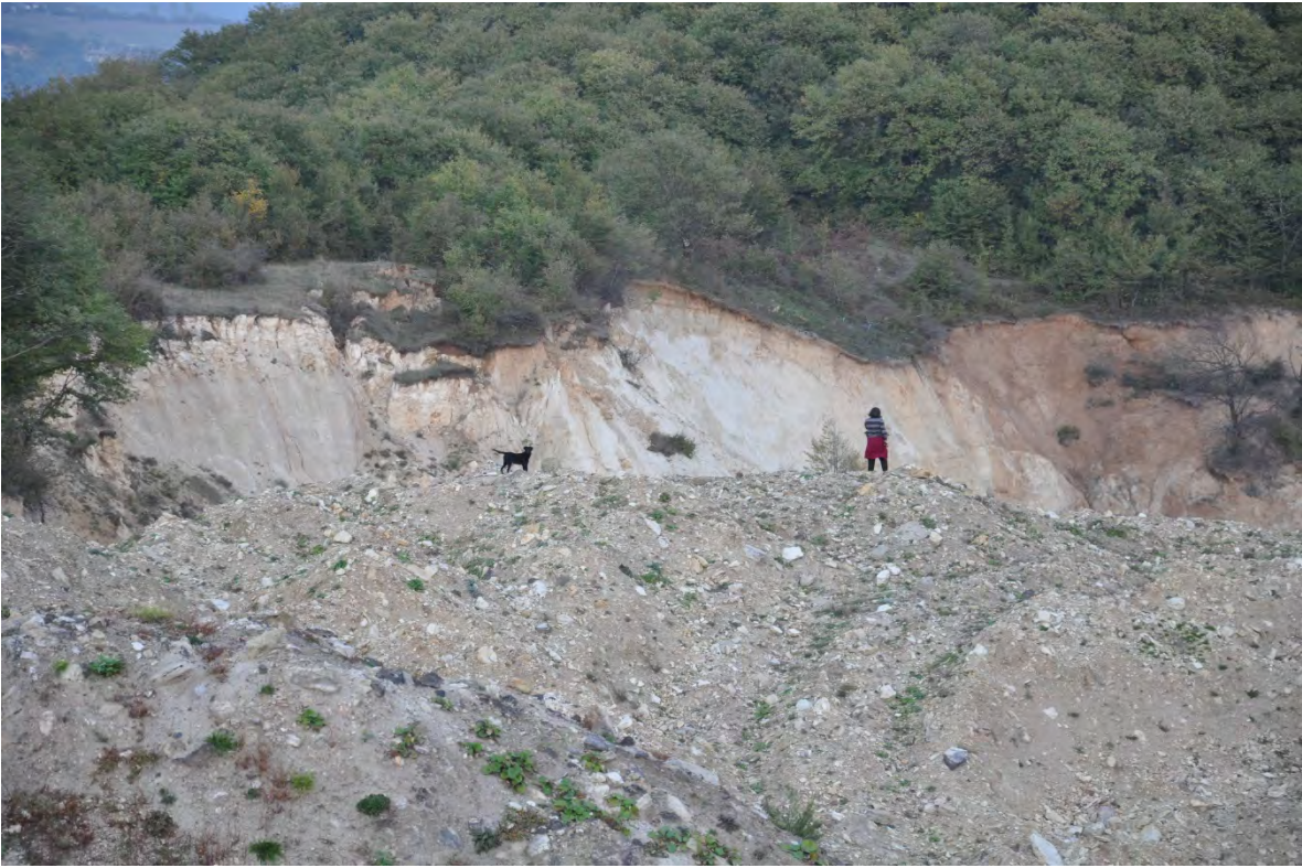
41. სოფ. რგანი. ღია კარიერული მოპოვება.