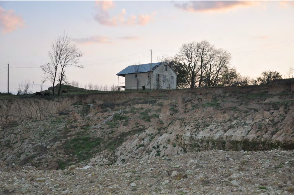
40. სოფ. რგანი. ღია კარიერული მოპოვება სახლებთან ახლოს.