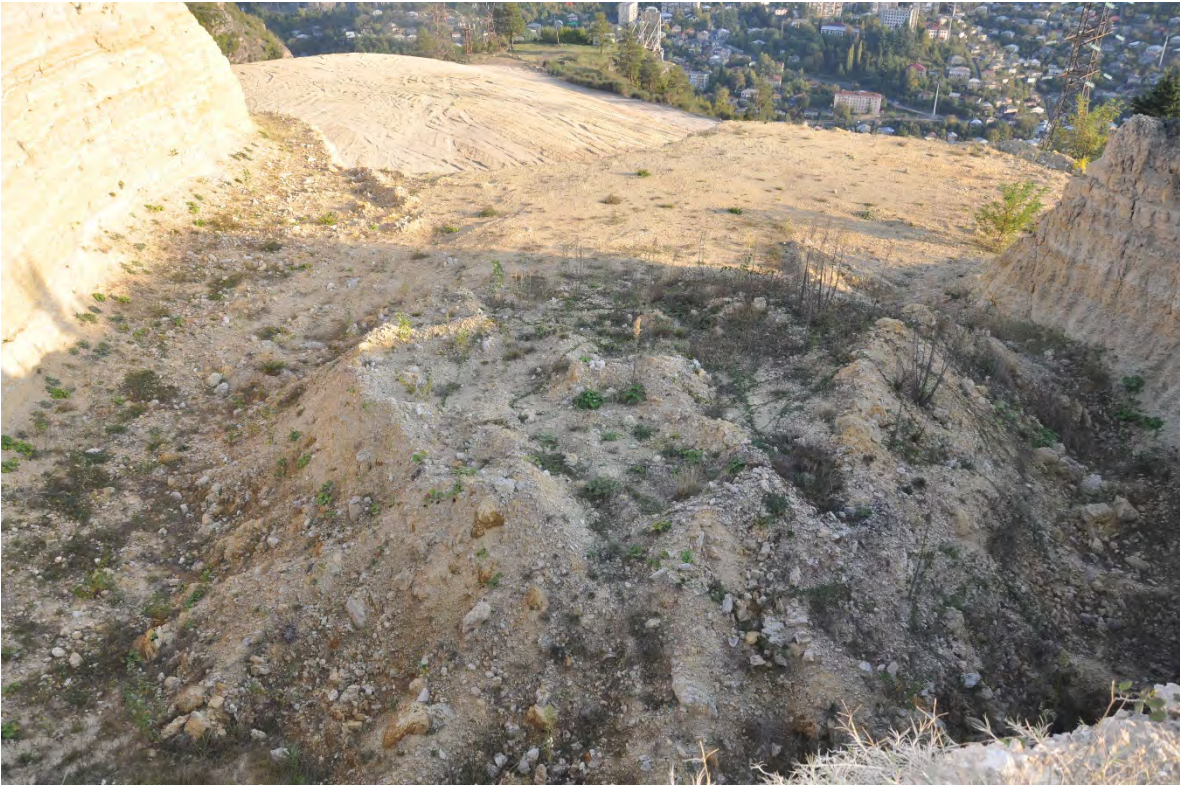
34. სოფ. ზედა რგანი. კომპანიამ მხოლოდ იმ ნაწილს ჩაუტარა ტექნიკური რეკულტივაცია, რომლის დანახვაც შესაძლებელია. დანარჩენი კი ისევ გადათხრილი დატოვა.