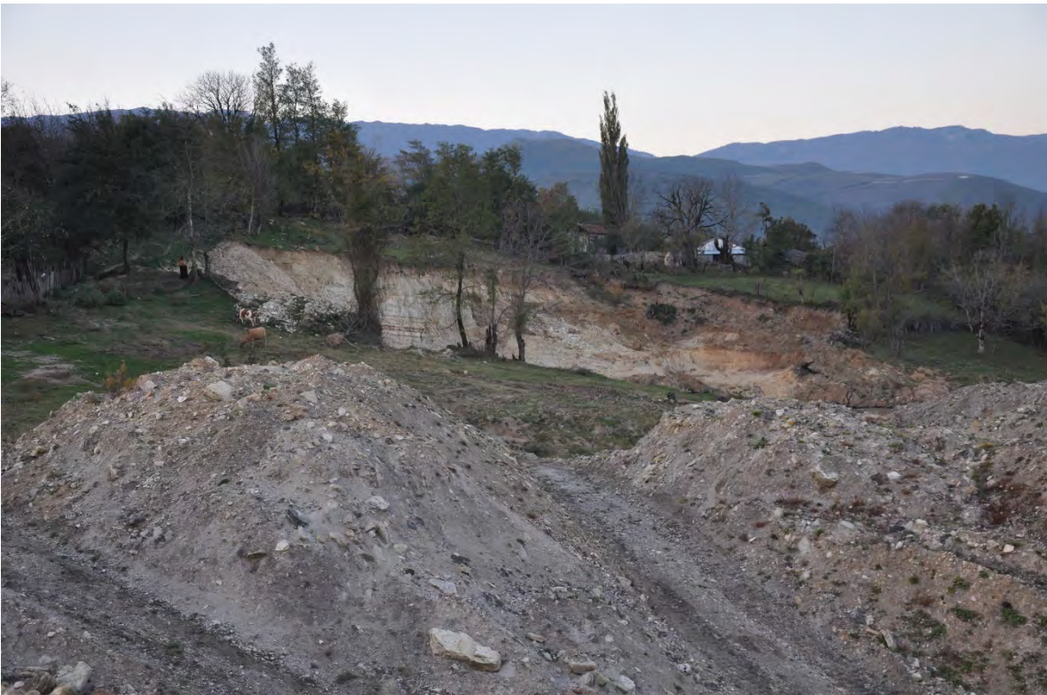
46. სოფ. რგანი. ღია კარიერული მოპოვება სახლებთან ახლოს.