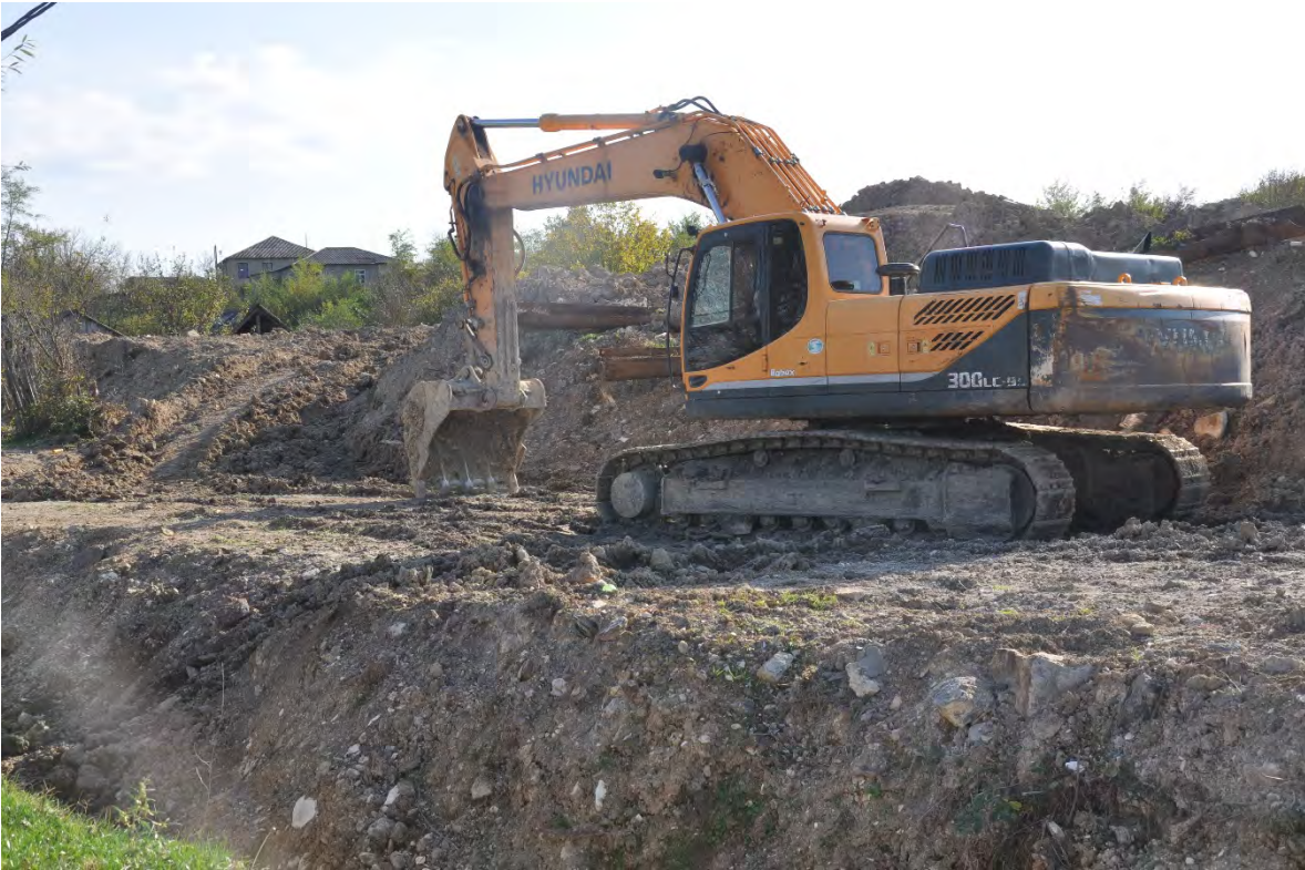
25. სოფ. მღვიმევი. ღია კარიერული მოპოვება სახლთან ახლოს.