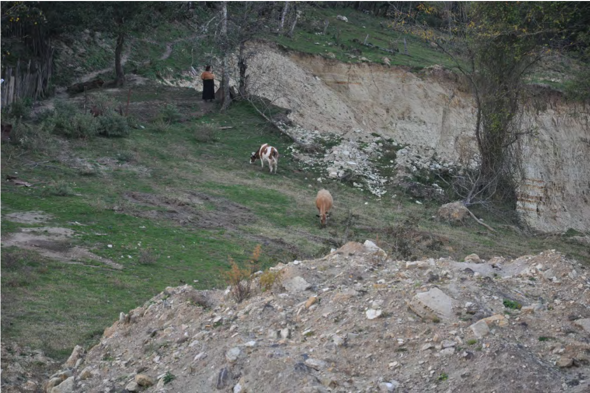
48. სოფ. რგანი. საძოვრების გარეშე დარჩენილი საქონელი და უიმედოდ დარჩენილი მოსახლეობა.