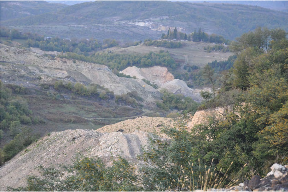
39. სოფ. რგანი. ღია კარიერული მოპოვება.