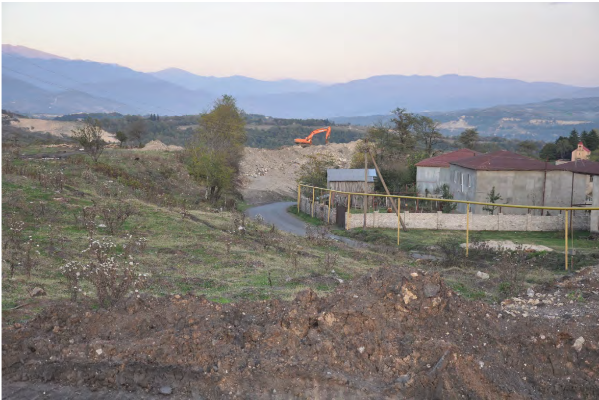
37. სოფ. რგანი. სოფლის ერთ უბანში მხოლოდ ეს სახლებიდაა დარჩენილი.