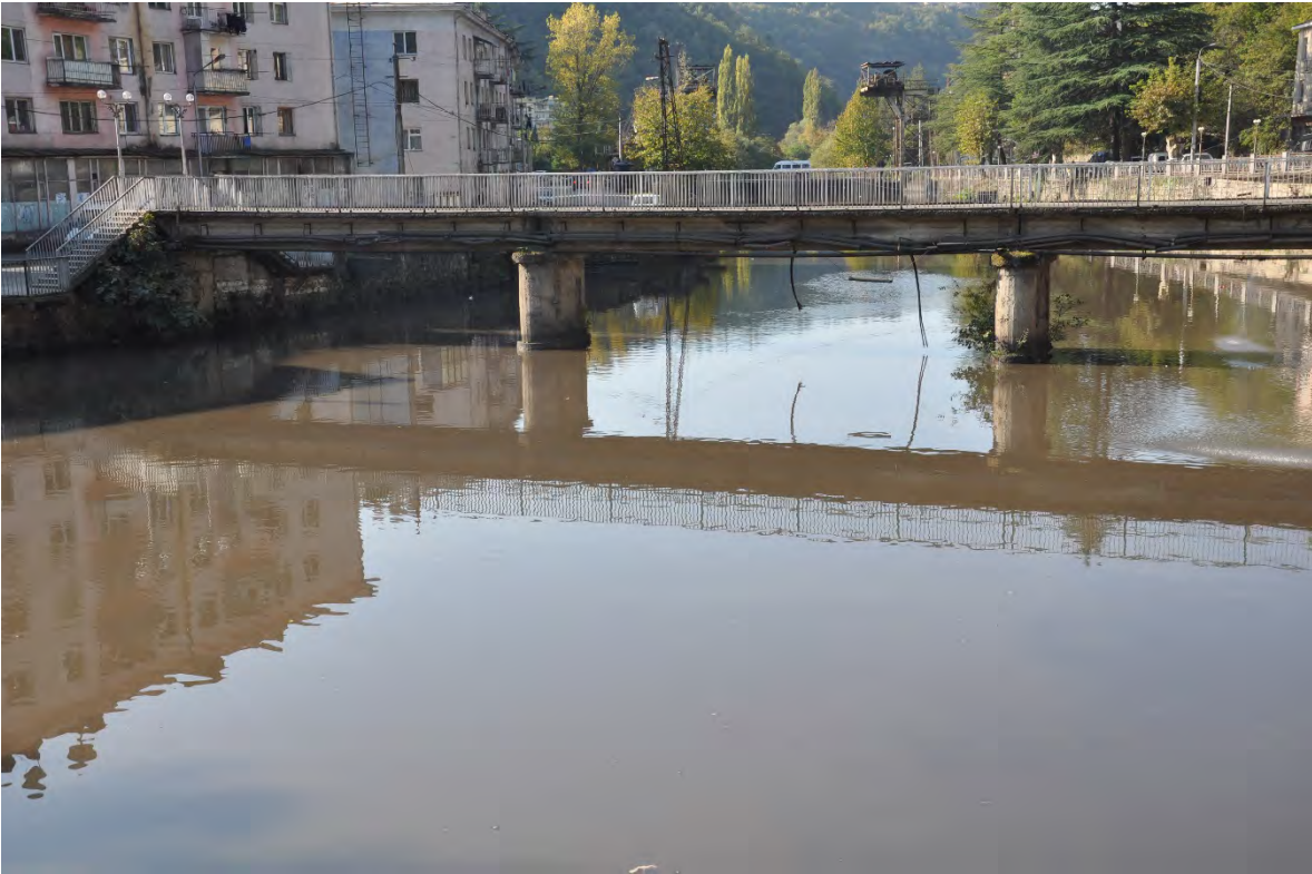
5. ჭიათურა. მანგანუმის გამამდიდრებელი ქარხნების მუშაობის შედეგად დაბინძურებული მდინარე ყვირილა.