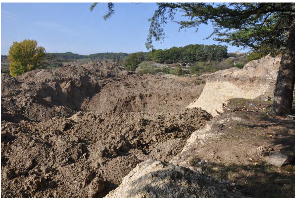
55. სოფ. დარკვეთი. ღია კარიერული მოპოვება.