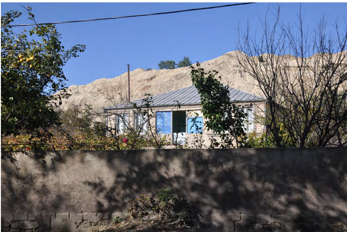
10. სოფ. მღვიმევი. ღია კარიერული მოპოვება სახლთან ახლოს.