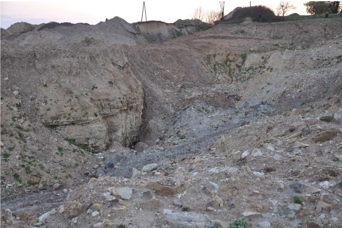
44. სოფ. რგანი. ღია კარიერული მოპოვება.