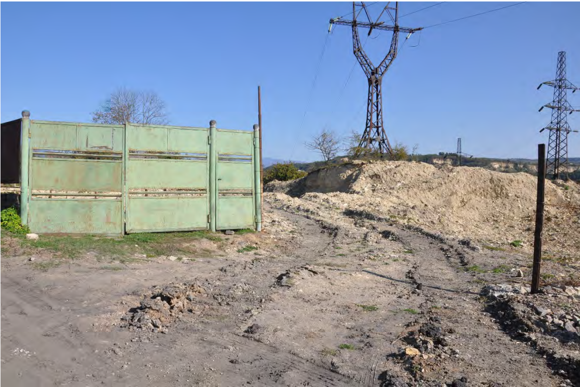
11. სოფ. მღვიმევი. მანგანუმის ათვისება ხდება ეზოში. სახლი უკვე დანგრეულია და მხოლოდ ღობე და ჭიშკარია დარჩენილი.