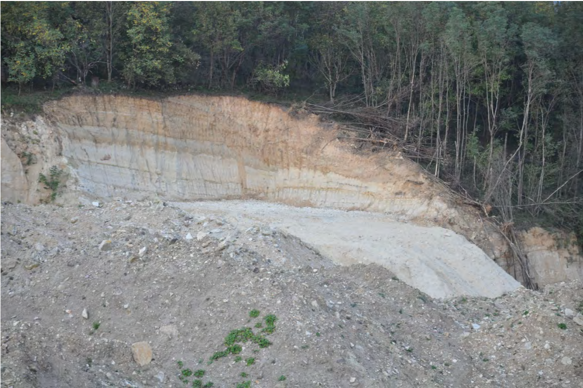
43. სოფ. რგანი. ღია კარიერული მოპოვება. სამუშაოების დროს მიწის მასას და ხეებს ესე თხრიან.