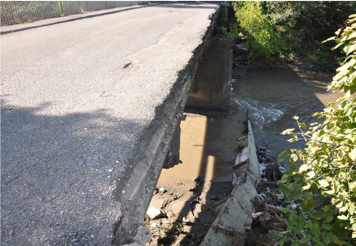
1. ქ. ჭიათურა. მძიმეწონიანი მანქანების გადაადგილების შედეგად ჩანგრეული ხიდი.