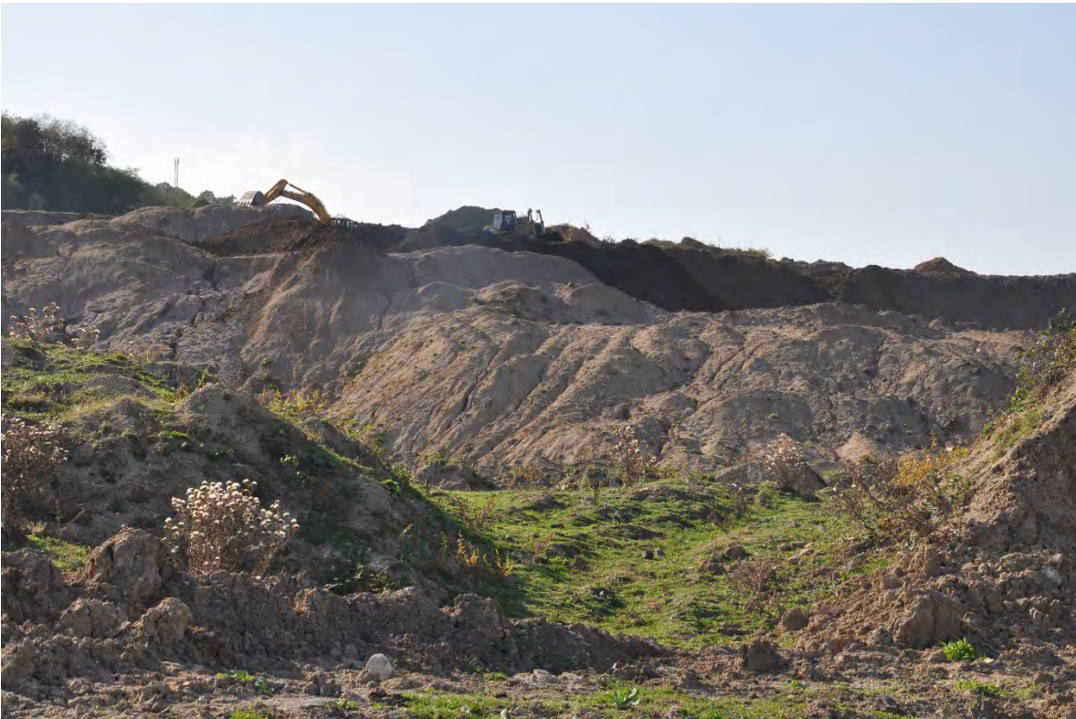
23. სოფ. მღვიმევი. ღია კარიერული მოპოვება.