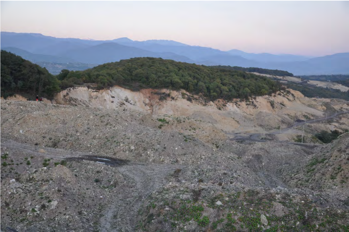
45. სოფ. რგანი. ღია კარიერული მოპოვება. ოდესღაც ეს ტერიტორია დასახლებული იყო.