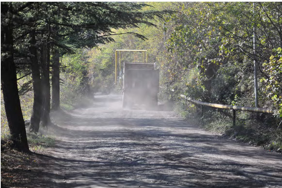
9. სოფ. მღვიმევი. მოსახლეობა მუდმივად ჩივის, რომ ჯორჯიან მანგანუმის და სხვა კოოპერატივების მანქანების გადაადგილების შედეგად ზიანდება გზა და ბინძურდება ჰაერი.