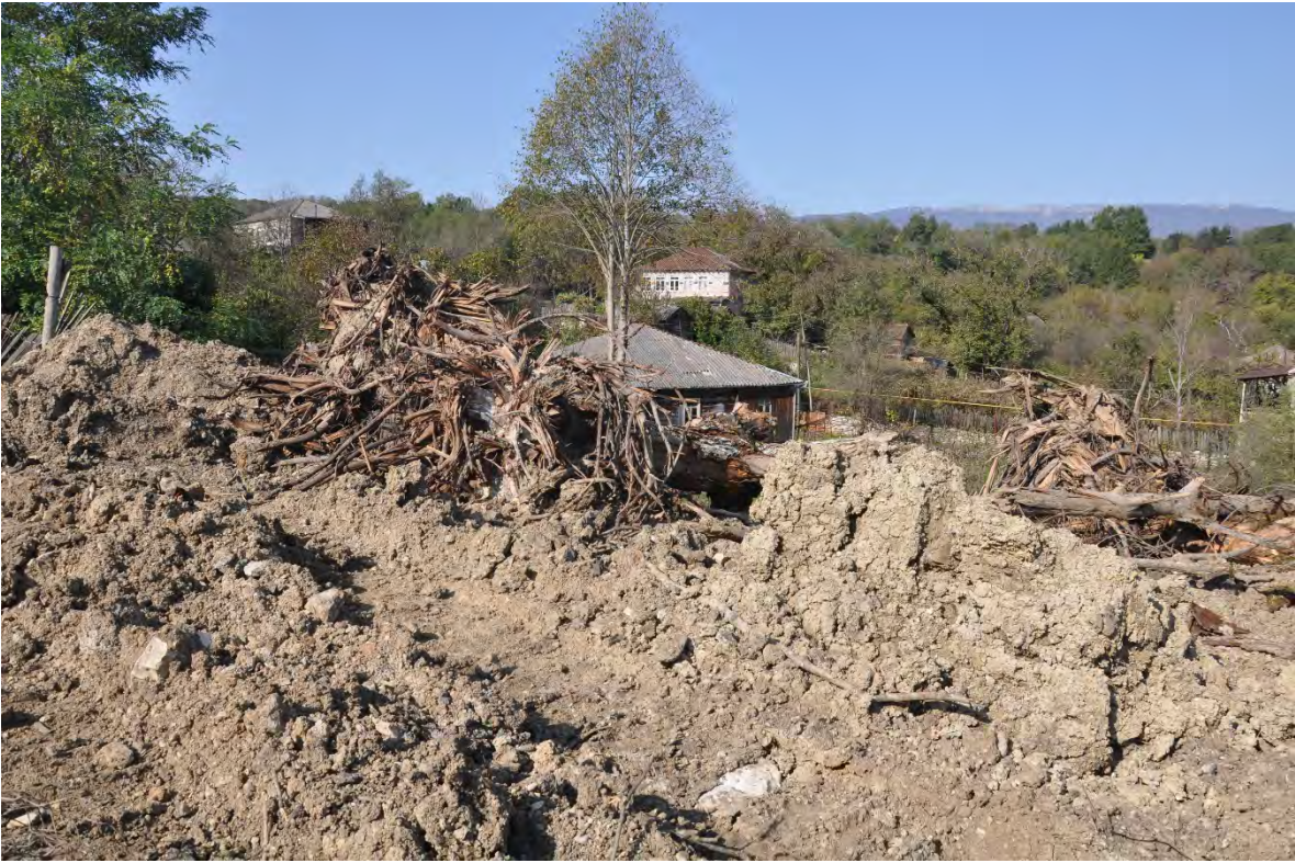
68. სოფ. დარკვეთი. ღია კარიერული მოპოვება სახლებთან ახლოს.