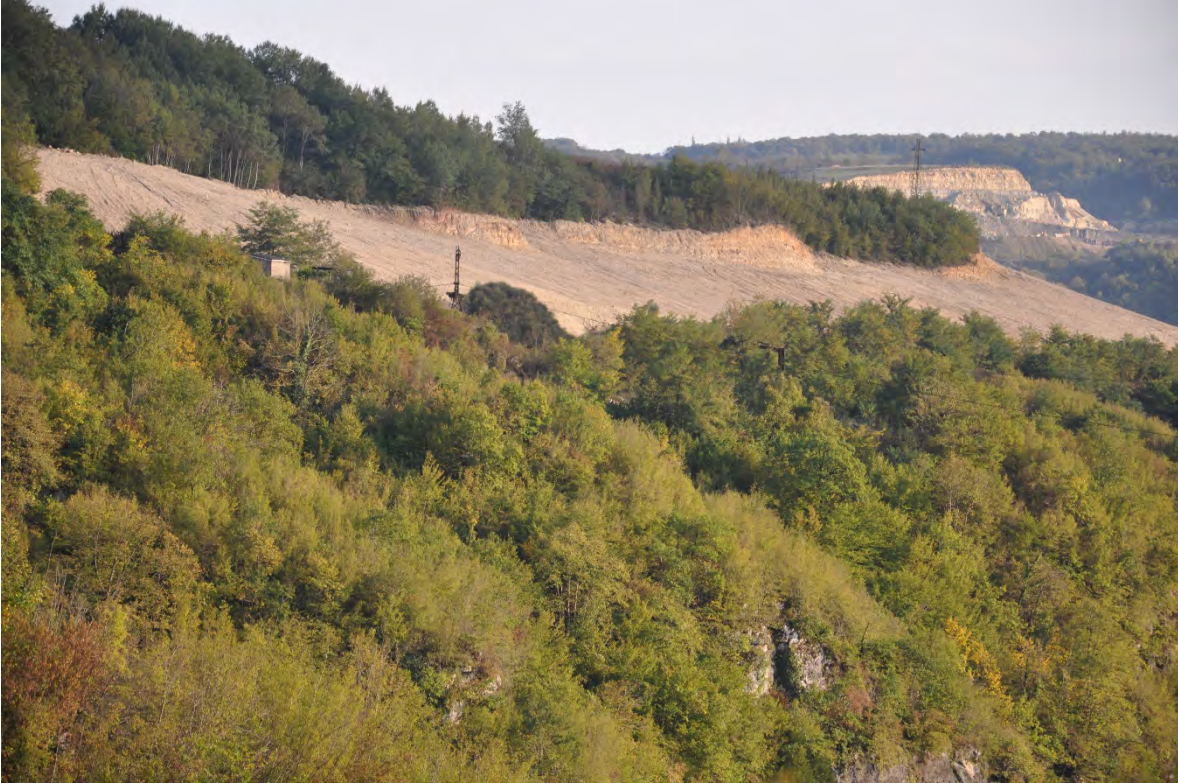
32. სოფ. ზედა რგანი. ჯორჯიან მანგანუმის მიერ ტექნიკურად რეკულტივირებული (მოსწორებული) ტერიტორია