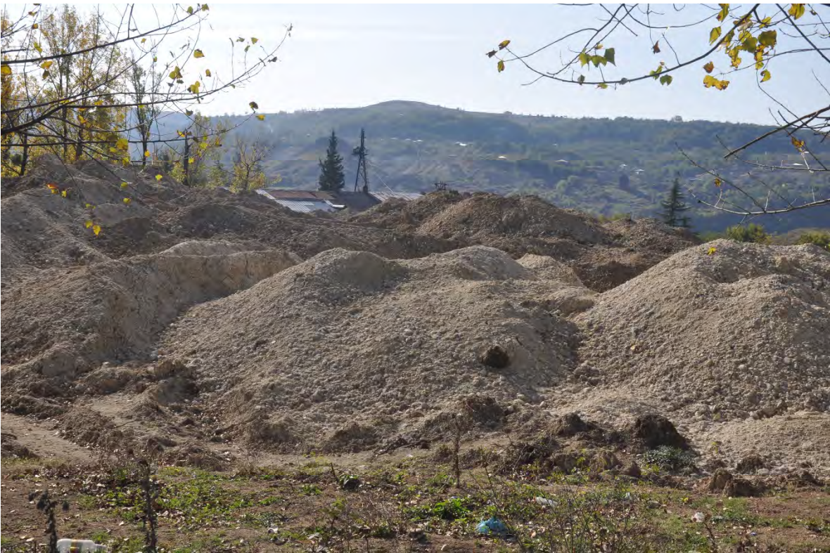
61. სოფ. დარკვეთი. ღია კარიერული მოპოვება.