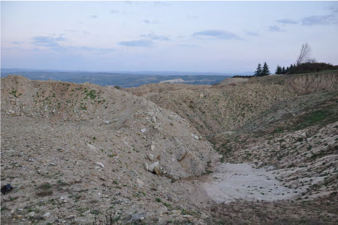
51. სოფ. რგანი. ღია კარიერული მოპოვება.