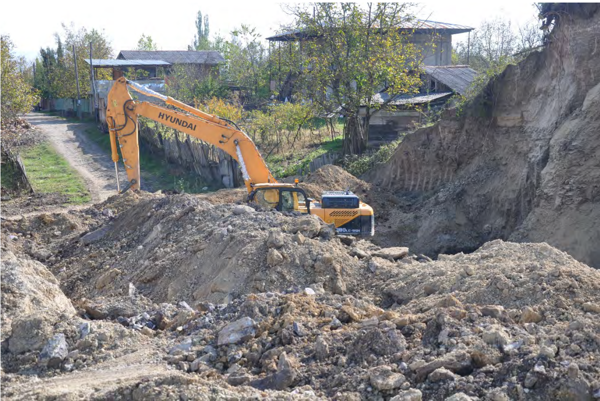
67. სოფ. დარკვეთი. ღია კარიერული მოპოვება სახლებთან ახლოს.