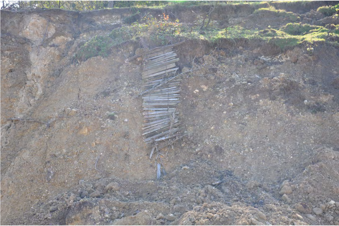
66. სოფ. დარკვეთი.