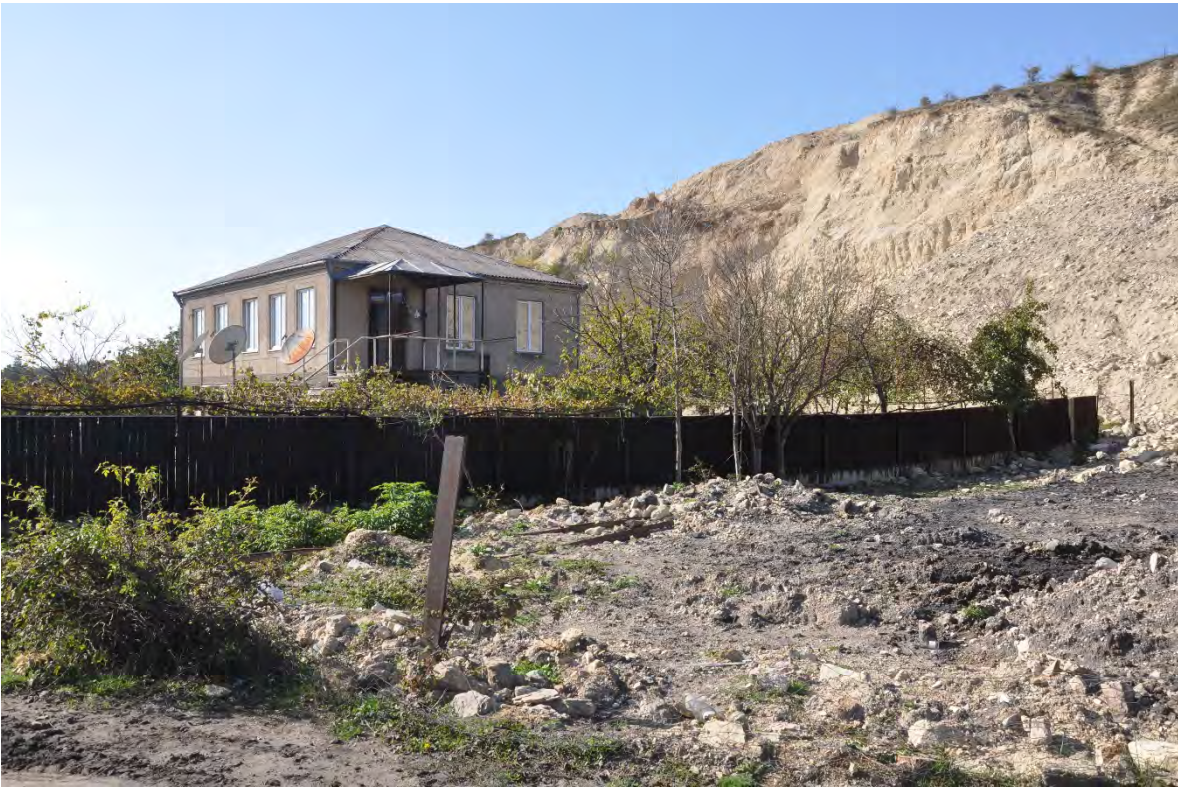
13. სოფ. მღვიმევი. ღია კარიერული მოპოვება სახლთან ახლოს.