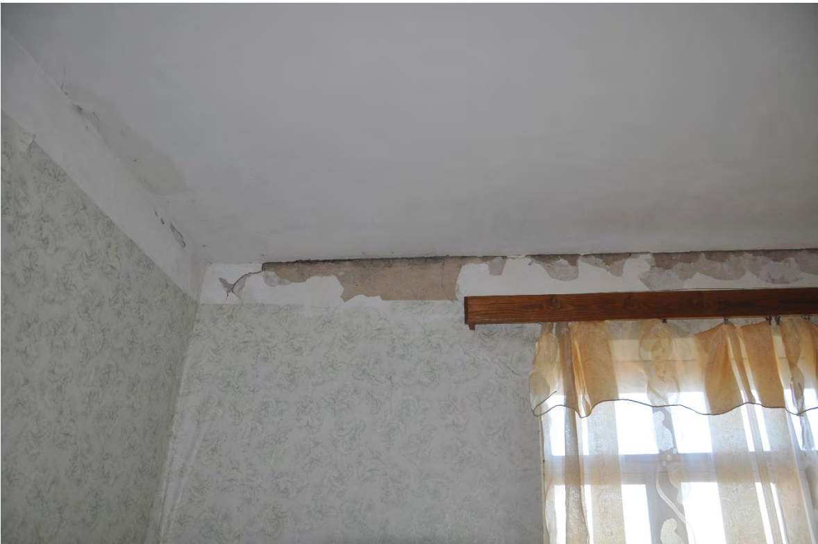
30. სოფ. მღვიმევი. მოსახლეობის თქმით, მანქანების გადაადგილებისა და მანგანუმის მოპოვების შედეგად სახლები დაეზარათ.