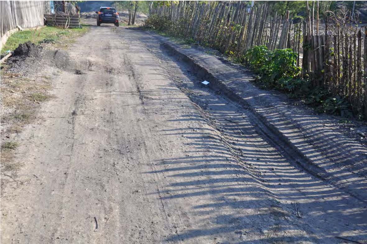
27. სოფ. მღვიმევი. მძიმეწონიანი მანქანების გადაადგილების შედეგად დაზიანებულია გზები.