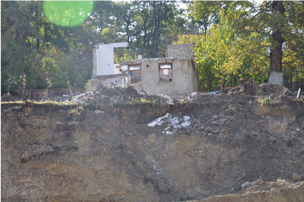
65. სოფ. დარკვეთი. კარიერზე ახალი დაწყებულია სამუშაოები. სახლების ნაწილი უკვე დანგრეულია.