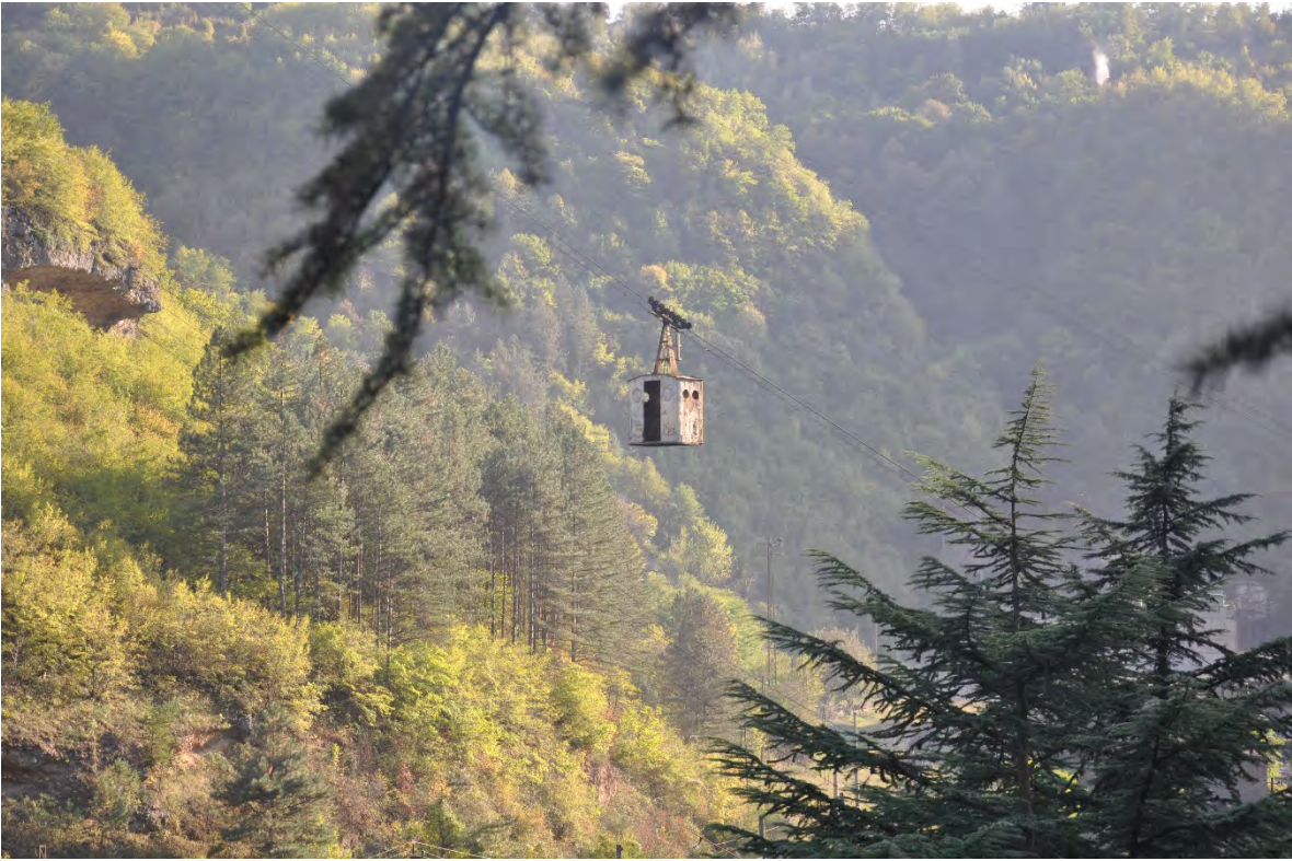
3. ქ. ჭიათურა. ბოლო სამი თვეა ყველა საბაგირო გაჩერდა. მოსახლეობის თქმით, რაც საბაგიროები აღარ მუშაობს ტურისტების რაოდენობამაც იკლო. ჯორჯიან მანგანუმს სარემონტო სამუშაოები უნდა დაეწყო, თუმცა დღემდე არაფერი გაუკეთებია.