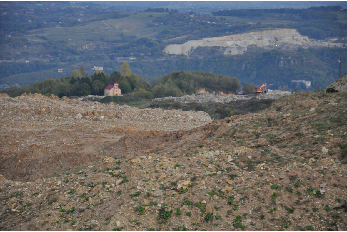
53. სოფ. რგანი.