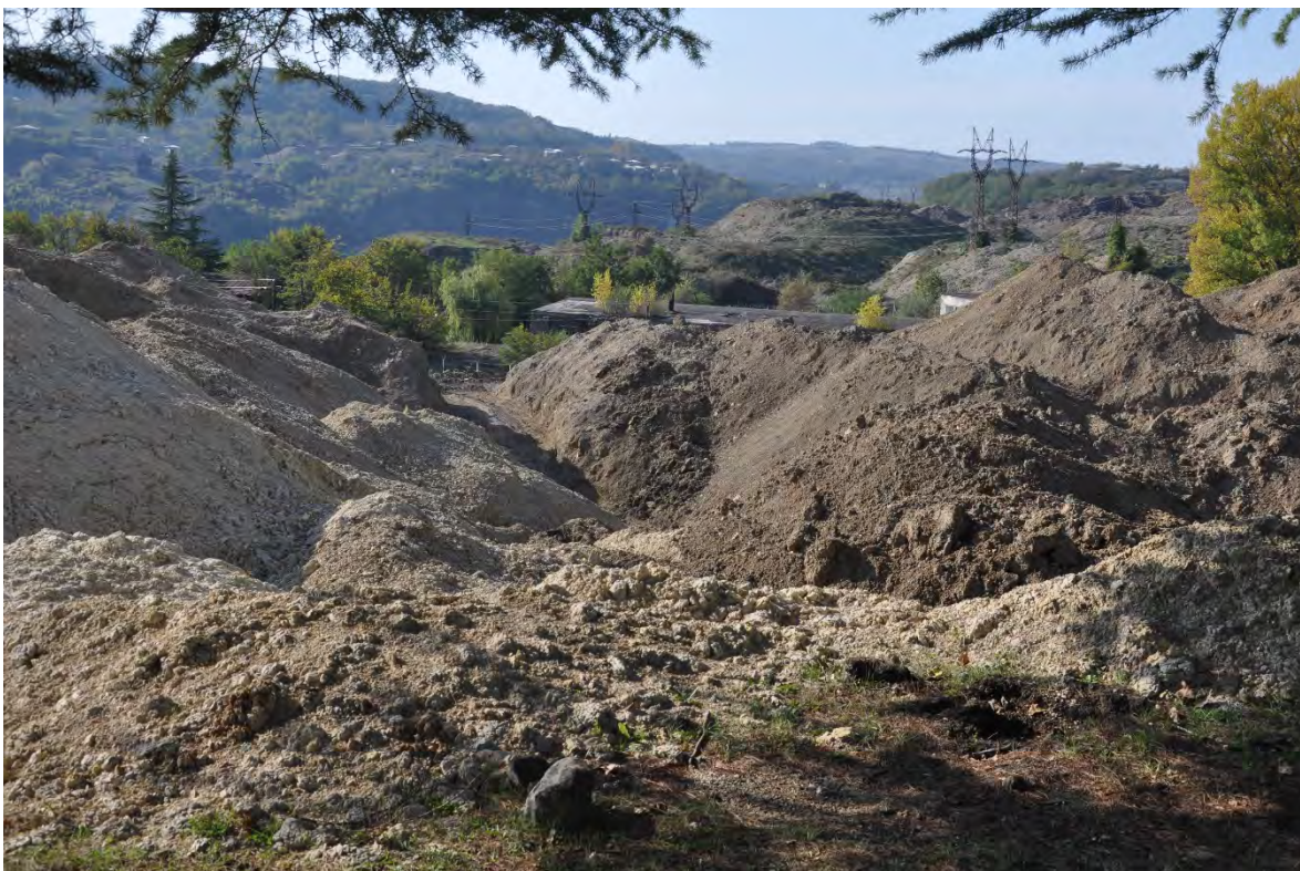
54. სოფ. დარკვეთი. ღია კარიერული მოპოვება.