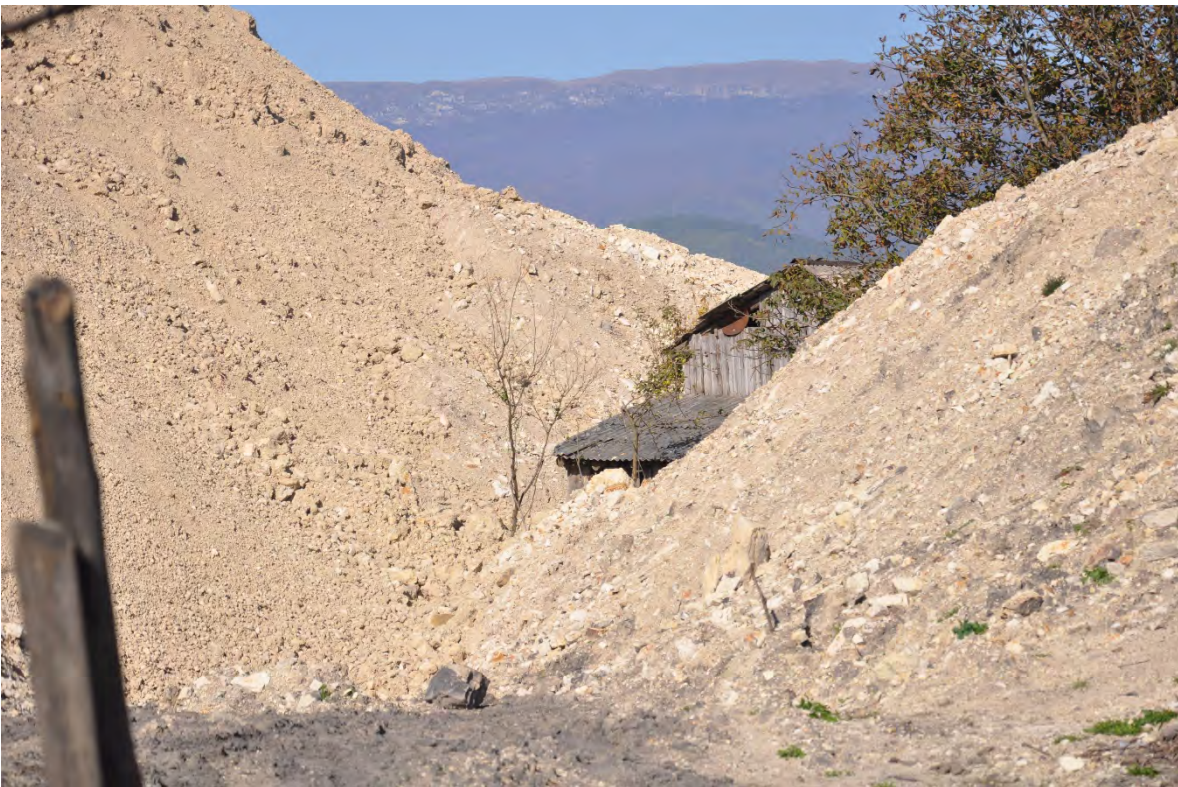
14. სოფ. მღვიმევი. ღია კარიერული მოპოვება სახლთან ახლოს.