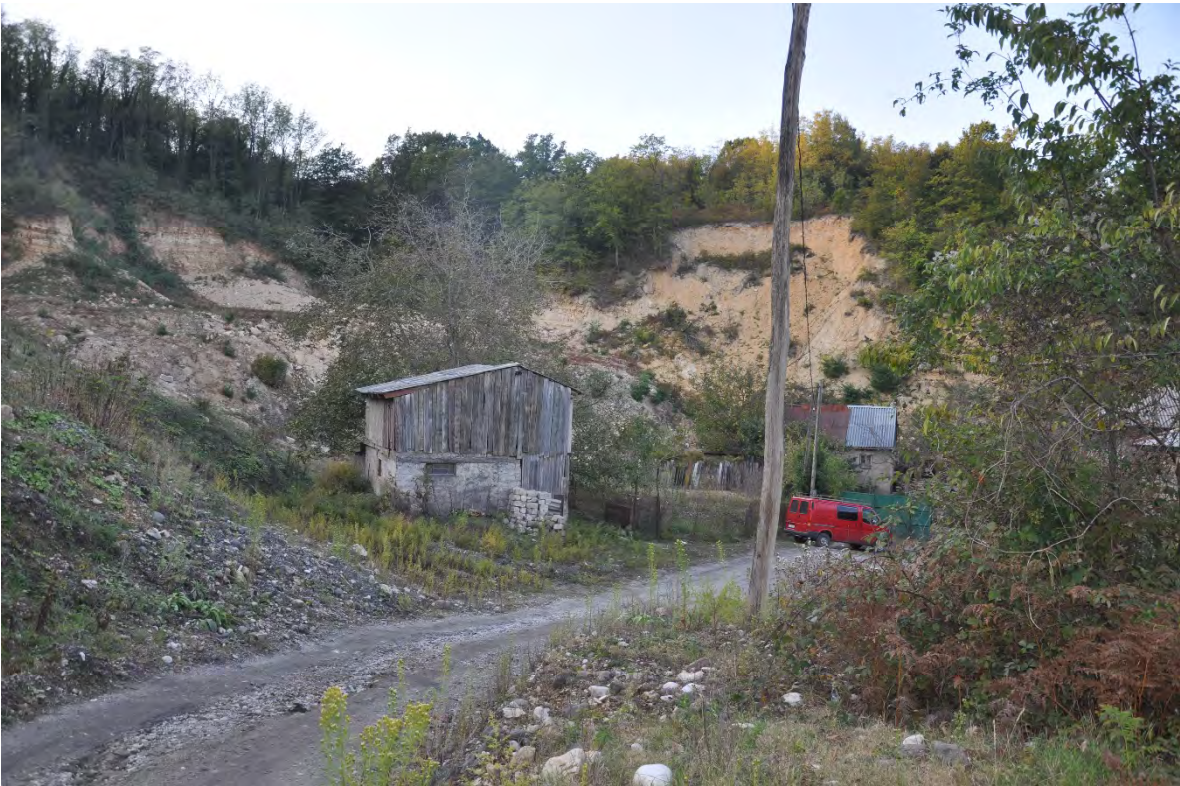
35. სოფ. ზედა რგანი. ღია კარიერული მოპოვება სახლებთან ახლოს.