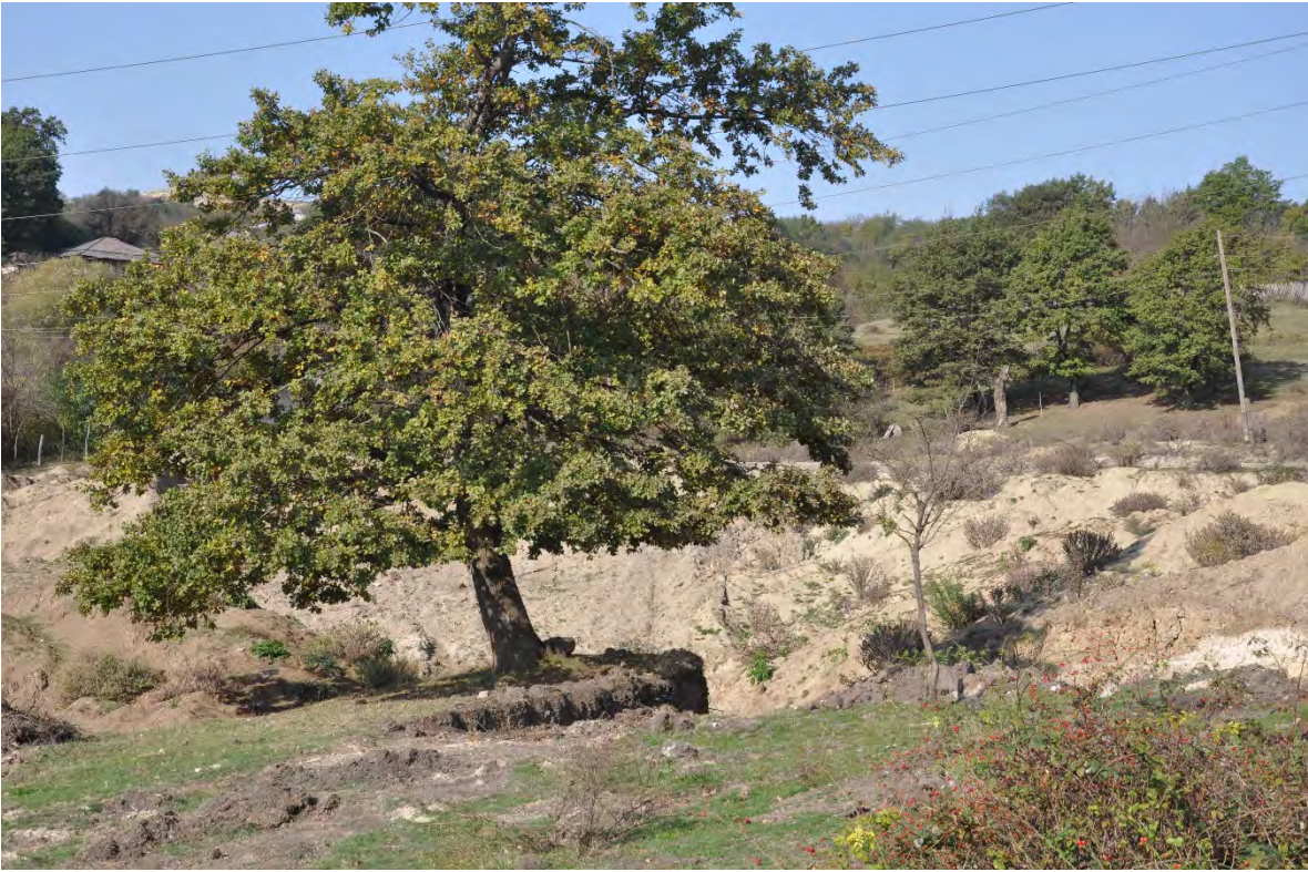
60. სოფ. დარკვეთი. ღია კარიერული მოპოვება.