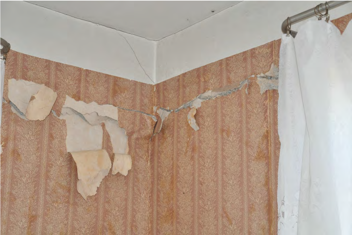
31. სოფ. მღვიმევი. მოსახლეობის თქმით, მანქანების გადაადგილებისა და მანგანუმის მოპოვების შედეგად სახლები დაეზარათ.