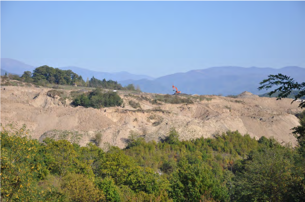
15. სოფ. მღვიმევი. ღია კარიერული მოპოვება.