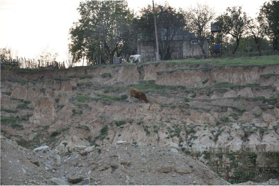
49. სოფ. რგანი. საძოვრების გარეშე დარჩენილი საქონელი.