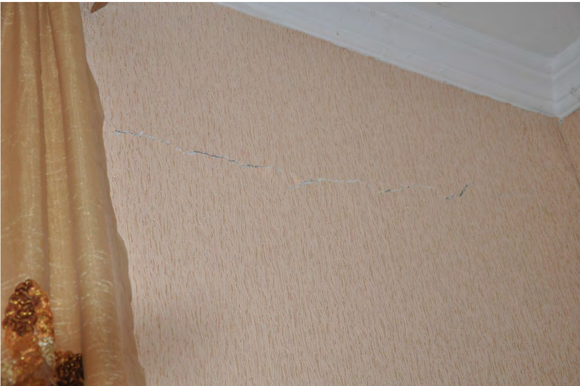
26. სოფ. მღვიმევი. მოსახლეობის თქმით, მანქანების გადაადგილებისა და მანგანუმის მოპოვების შედეგად სახლები დაეზარათ.