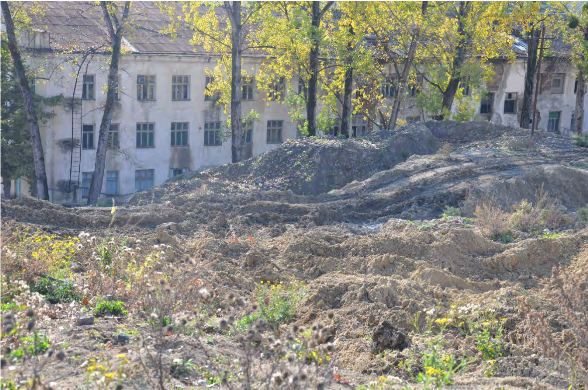
57. სოფ. დარკვეთი. ღია კარიერული მოპოვება.