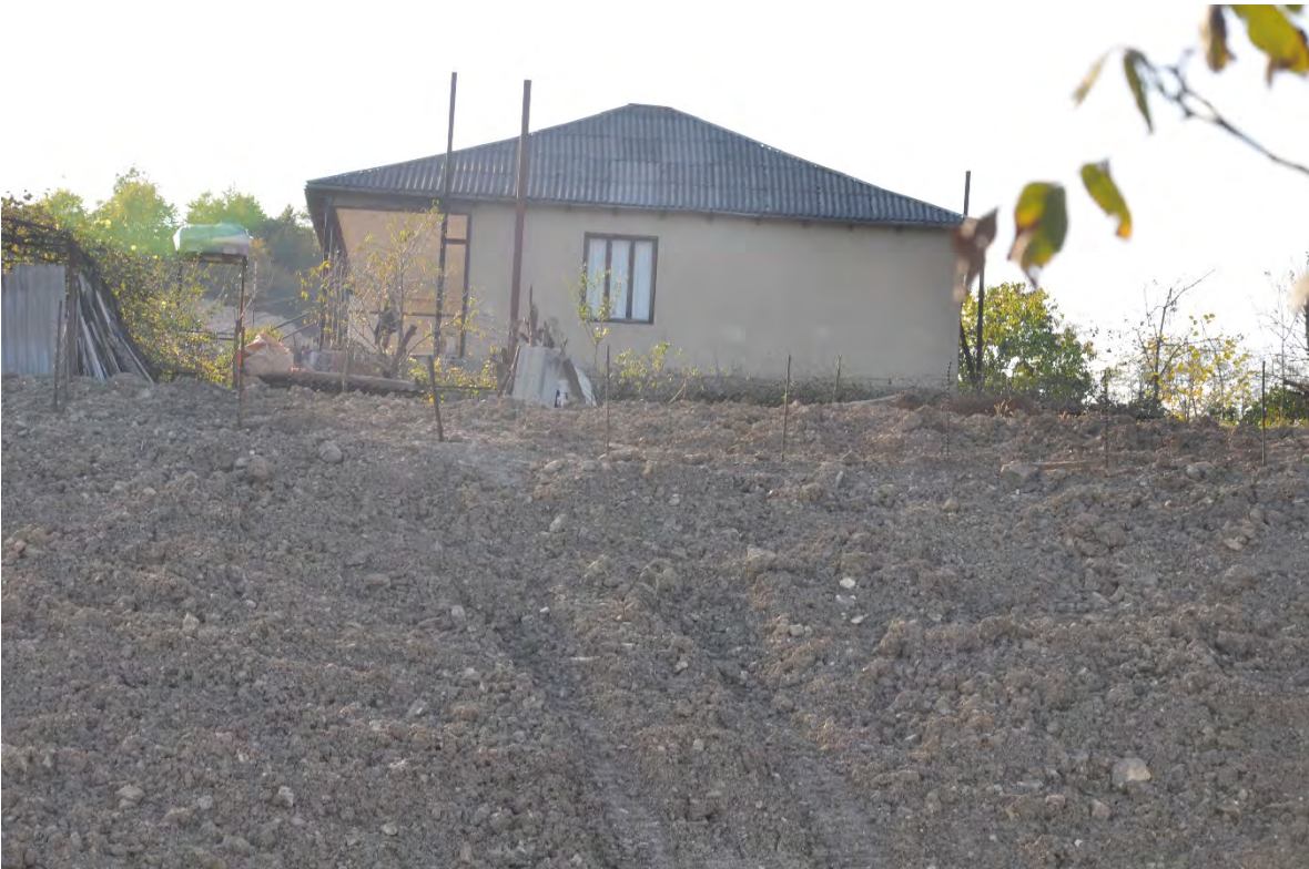
28. სოფ. მღვიმევი. ღია კარიერული მოპოვება სახლთან ახლოს.