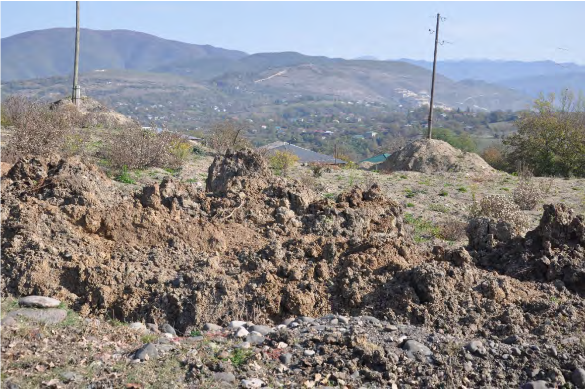
62. სოფ. დარკვეთი. ღია კარიერული მოპოვება სახლებთან ახლოს.