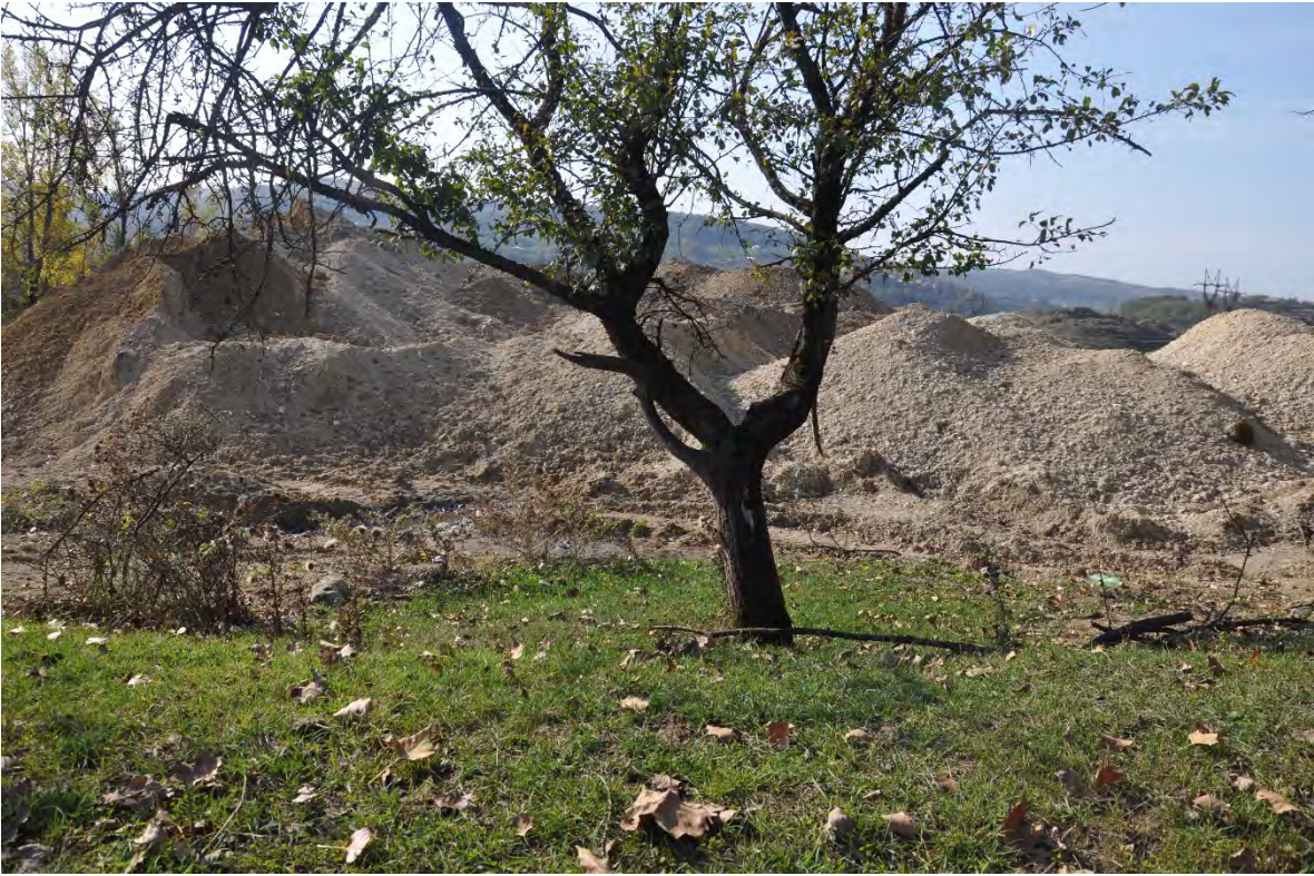
56. სოფ. დარკვეთი. ღია კარიერული მოპოვება.