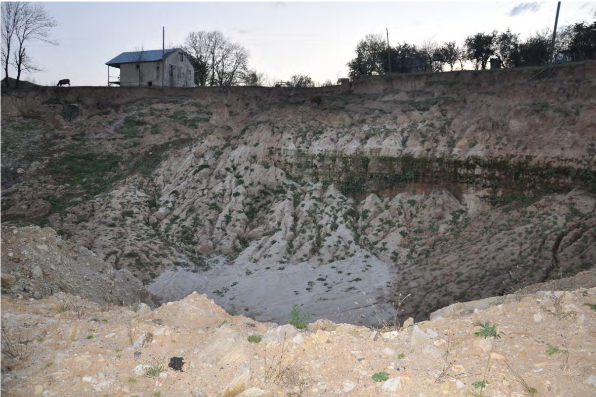
50. სოფ. რგანი. ღია კარიერული მოპოვება სახლებთან ახლოს.