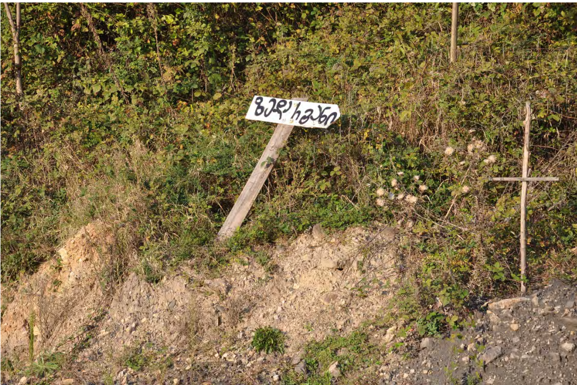
33. სოფ. ზედა რგანი. სოფელიც ისეთივე დღეშია როგორც ეს ტრაფარეტი