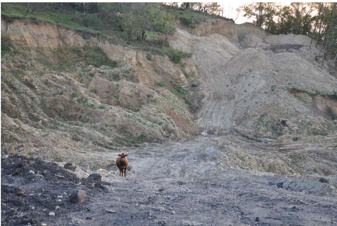
38. სოფ. რგანი. საძოვრების გარეშე დარჩენილი საქონელი.