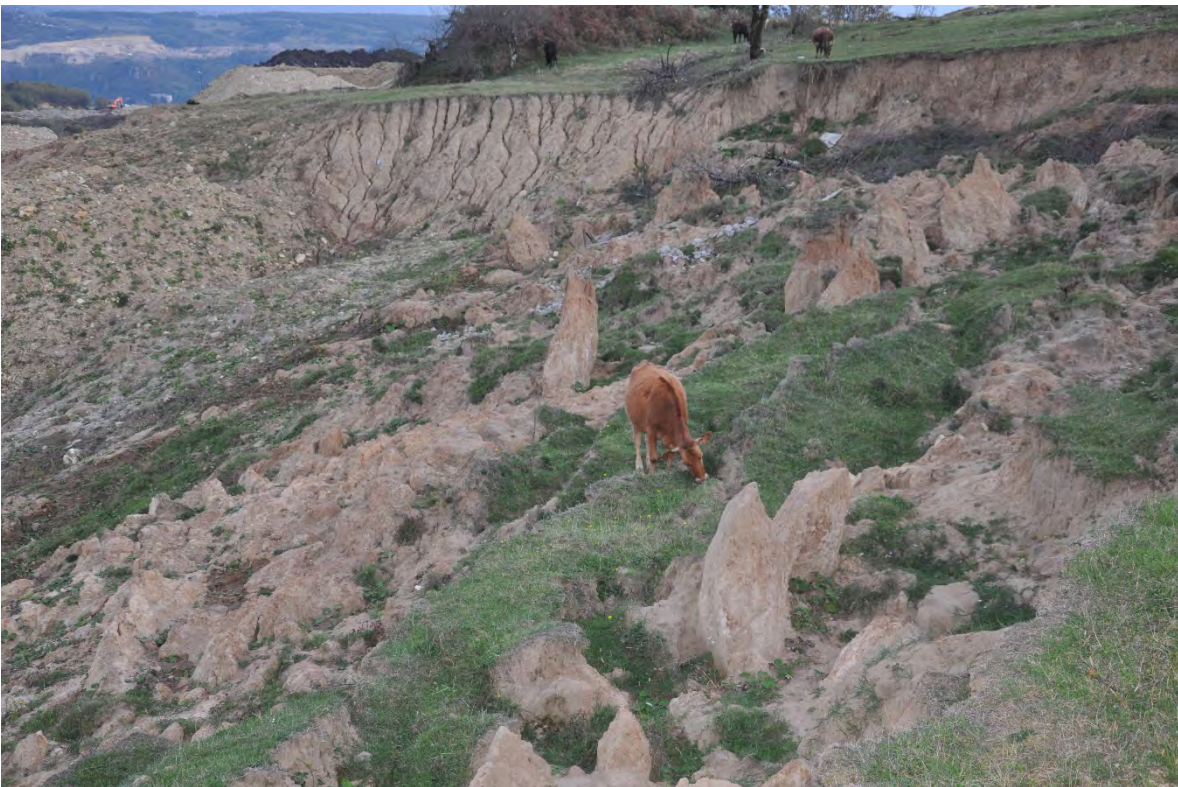
52. სოფ. რგანი. საძოვრების გარეშე დარჩენილი საქონელი.