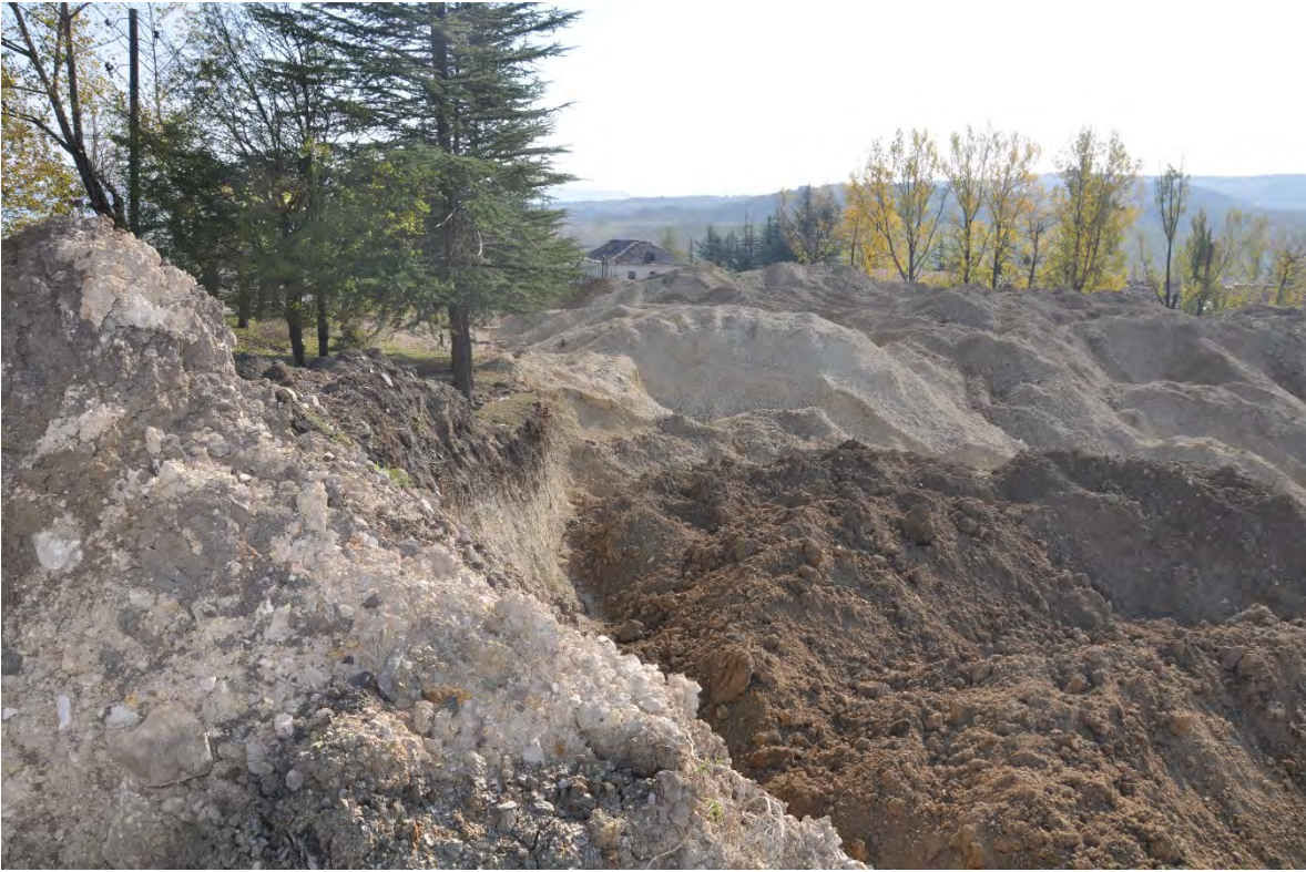
58. სოფ. დარკვეთი. ღია კარიერული მოპოვება.