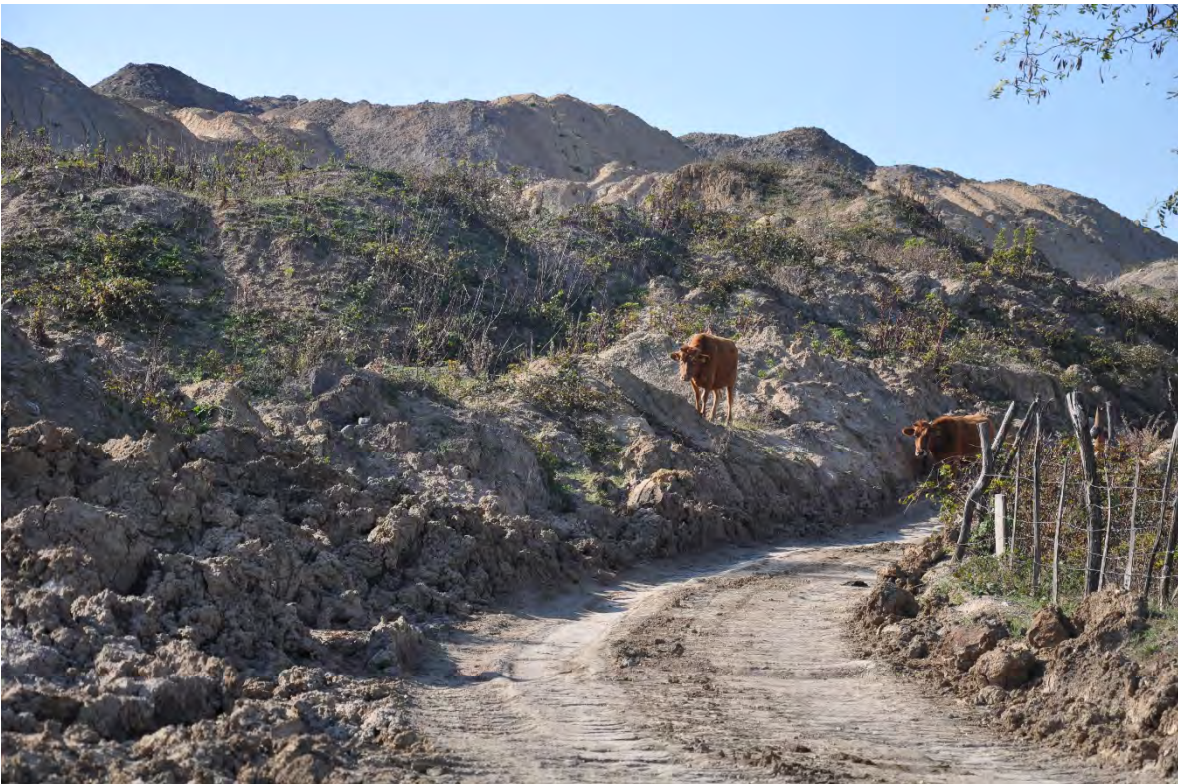
22. სოფ. მღვიმევი. ჰერ კიდევ ერთი წლის წინ აქ სახლები იყო. ტერიტორია ახლა მთლიანად ათვისებულია და რეკულტივაციის გარეშეა მიტოვებული.