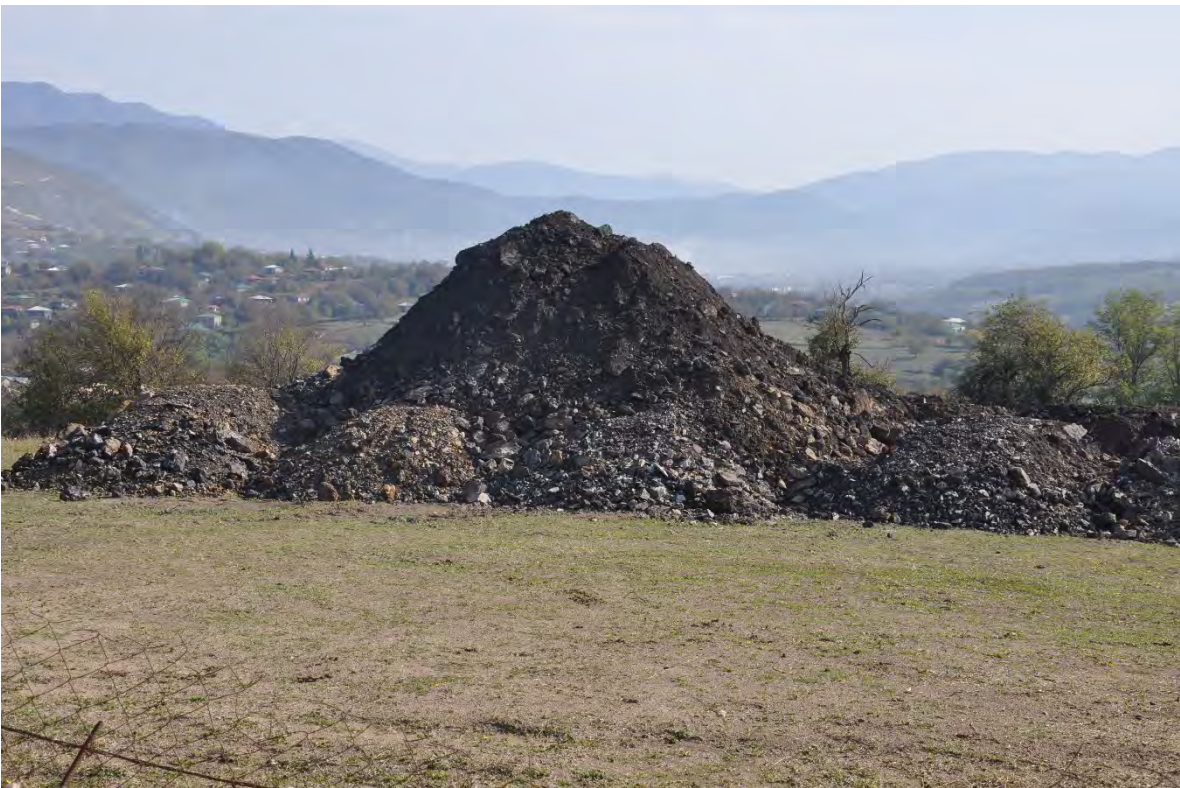
63. სოფ. დარკვეთი.