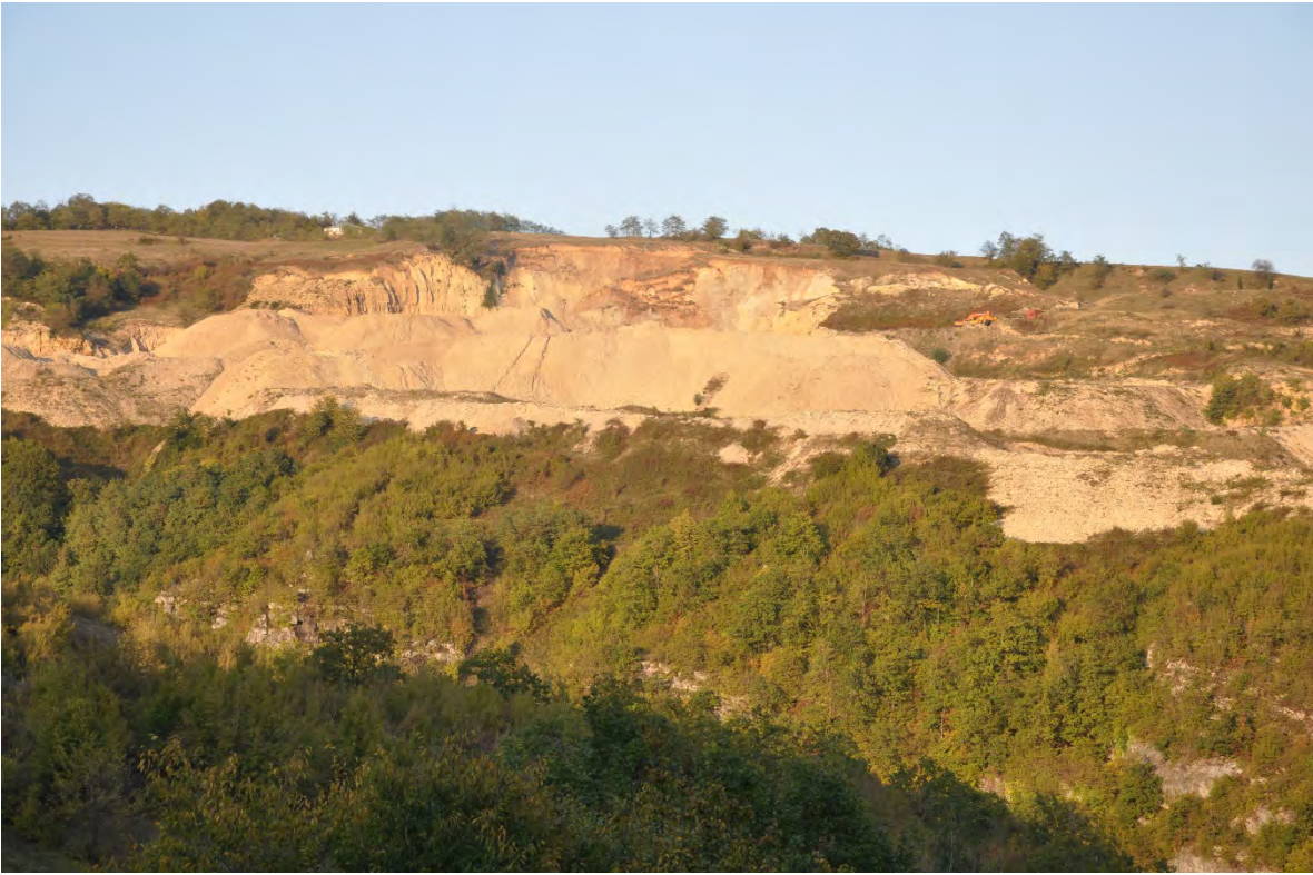
36. სოფ. ზედა რგანი. ღია კარიერული მოპოვება.