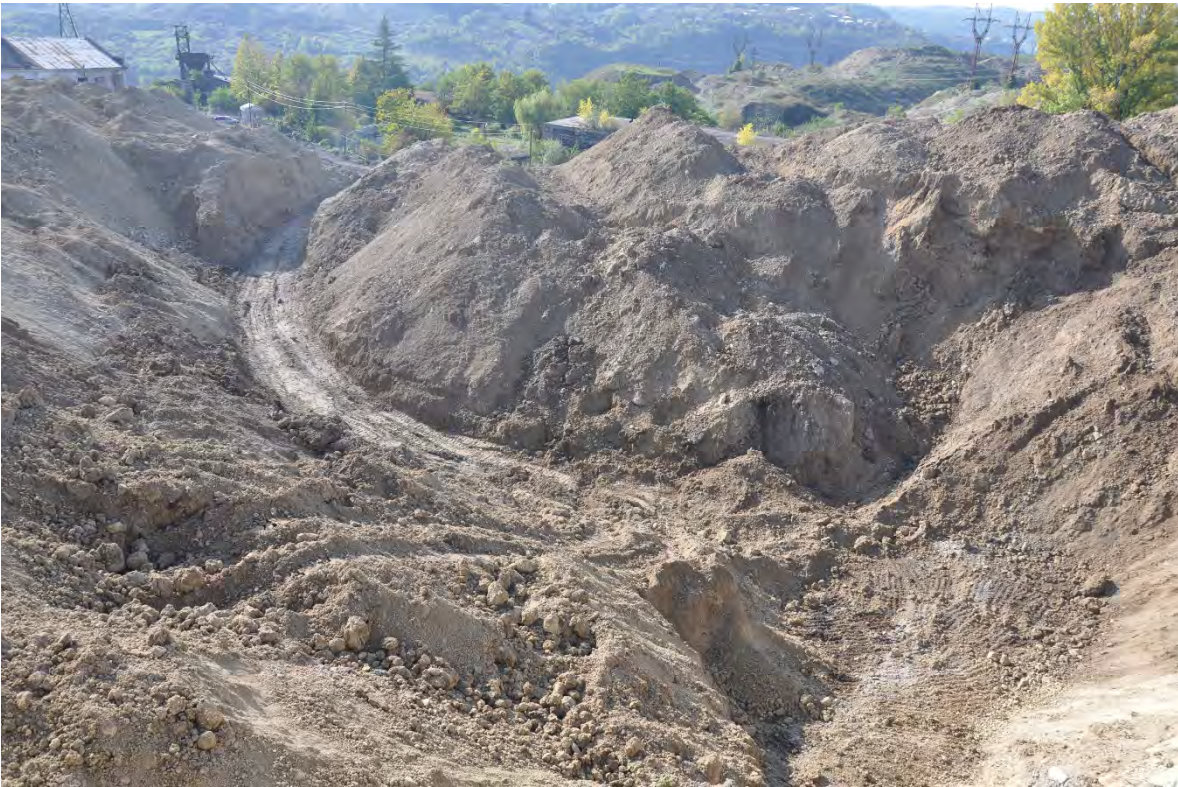
59. სოფ. დარკვეთი. ღია კარიერული მოპოვება.