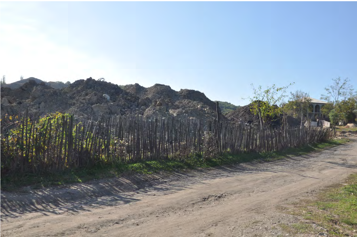
16. სოფ. მღვიმევი. ღია კარიერული მოპოვება.