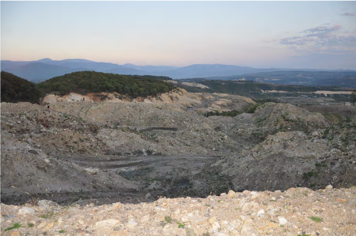
42. სოფ. რგანი. ღია კარიერული მოპოვება. მოსახლეობის გარეშე დარჩენილი სოფელი.