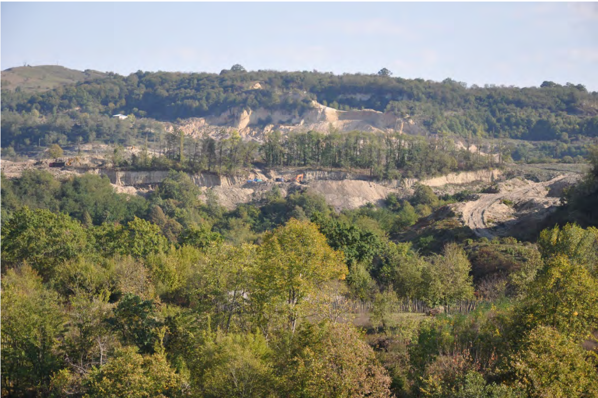
20. სოფ. მღვიმევი. ღია კარიერული მოპოვება.