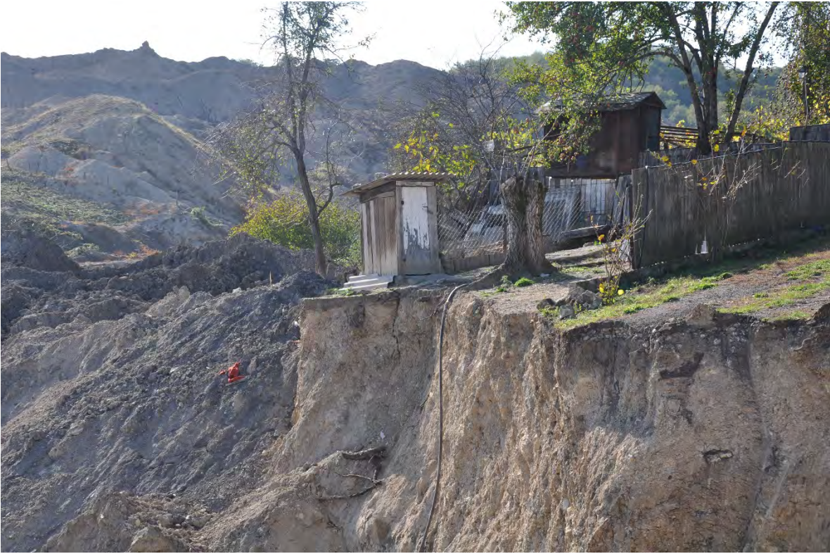
19. სოფ. მღვიმევი. მოქმედი საპირფარეშო, სადაც შესვლა შეიძლება უკანასკნელი აღმოჩნდეს ვინმეს ცხოვრებაში.