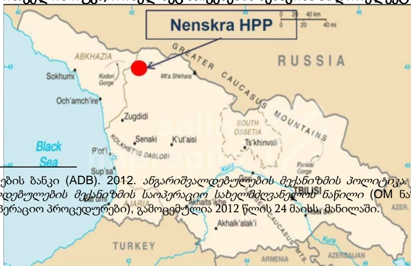
გრაფიკი 1: საქართველოს რუკა, რომელზეც ნაჩვენებია ნენსკრას ჰიდროელექტროსადგური

3. პროექტი ხორციელდება ვიწრო, თვალწარმტაც მთის ხეობაში - მდინარე ნენსკრას ხეობაში, რომელიც მდებარეობს საქართველოს ჩრდილო-დასავლეთ ნაწილში, რუსეთის საზღვართან ახლოს, სამეგრელო-ზემო სვანეთის რეგიონში. ხეობა დასახლებულია 1,100 მუდმივი მაცხოვრებლით (268 ოჯახი), რომლებიც ცხოვრობენ მდინარის გასწვრივ 13 სოფელში. კაშხალი, წყალსაცავი და ჰიდროელექტროსადგური მდებარეობს მდინარე ნენსკრას ხეობაში, თუმცა წყალსაცავში წყლის ჩადინება მოხდება ასევე ხეობის ახლომდებარე, ნაკრას მდინარიდან, ნაკრას მდინარის ხეობაში მოხდება წყალშემკრები დამბის მშენებლობა და წყალი გვირაბის გავლით მიეწოდება წყალსაცავს. ნაკრას ხეობის ხუთ სოფელში 300 მუდმივი მოსახლე ცხოვრობს (85 ოჯახი). ორივე ხეობის მოსახლეობის