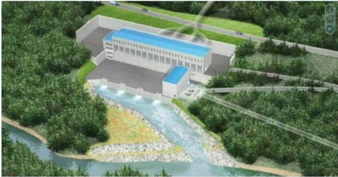
გრაფიკი 4: ელექტროსადგურის სურათი მისი დასრულების შემდეგ