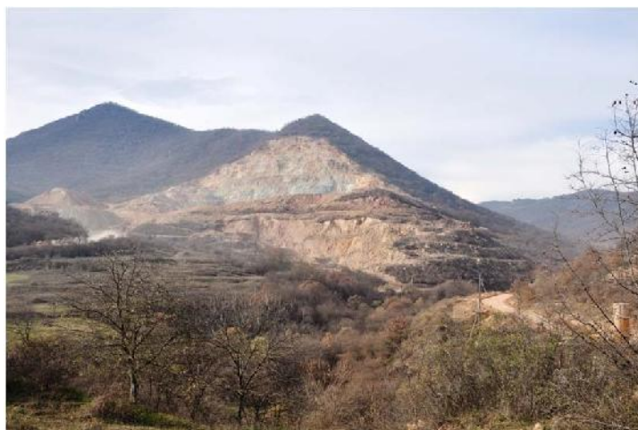
ჭიათურა, წიაღის მოპოვება წაბლის ტყის ტერიტორიაზე