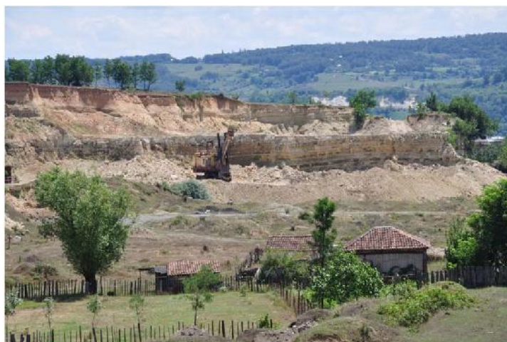
ჭიათურა, სოფ. ზემო რგანი