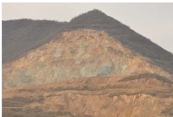
დიდი მადლოზა ყურადღებისათვის