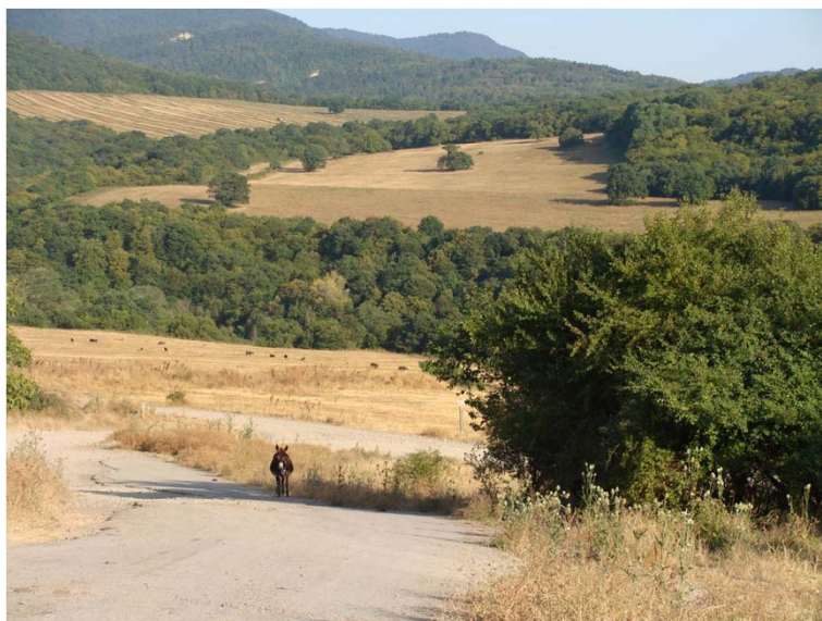
დიდი მადლობა ყურადღებისათვის